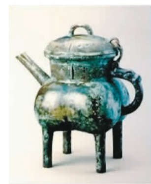
二十世纪初出土的克盃和克罍。

文物保护专业人员全程参与考古发掘工作,针对不同材质遗物进行因地制宜的文物保护,对木杆、席痕、朱砂、织物等有机类文物,使用薄醇等