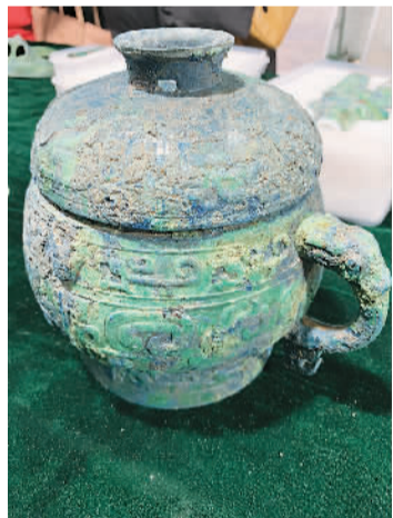
琉璃河遗址发掘区M1901墓非常著名。历经多次发掘出土了许多文物。此次出土的这件铜簋的盖子,就是在下葬时与前期出土的青铜簋“安”混了。

在琉璃河遗址发掘区,有一个巨大的圆形深坑,底部有少量积水。这个曾出土大墓的大墓现在编号为M1901,考古人员从中挖出一件铜簋,器盖内铭文为“白(伯)鱼作宝尊彝”,器内底铭文为“王癸于成周,王赐鬲贝,用作宝尊彝”。琉璃河遗址考古发掘现场负责人王晶介绍,铜簋与40多年前出土的鬲纹敦纹饰相同,据铭文推断,这两件簋的盖、身在下葬时是混淆了,整整错了3000年,这也证明了(伯)鱼和