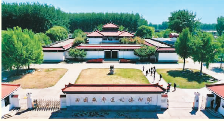
位于北京市房山区琉璃河董家村的西周燕都遗址博物馆。

北岸的山前剥蚀夷平低地。大石河发源于太行山山脉,古称圣水,亦名琉璃河、刘李河,自西北方而来,蜿蜒流经燕都的西部和南部,形成一个“U”形的河湾,再向东南方流去。 琉璃河燕都选在河道弯曲的河内湾怀抱处,这样的沉积凸岸有利于泥沙的堆积、土壤的形成;水流较缓,有利于取水;凸岸三面环水,可作防御之用。进行建造,选址背山面阳,符合我国传统聚落选址所崇尚的山水环绕的理想环境要素。