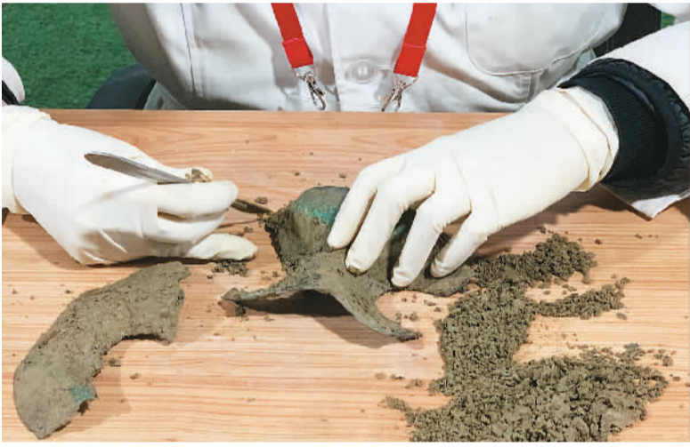
近日,考古人员在琉璃河遗址现场整理出土文物。