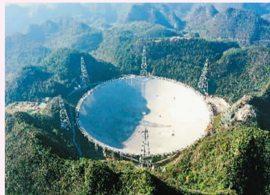
“中国天眼”全景。

据悉，FAST自2020年1月通过国家验收以来，运行效率和质量不断提高，年观测时长超过5300小时。2021年3月，FAST正式向全球开放共享，已有14个国家（不含中国）的27份国际项目获得批准并启动科学观测。