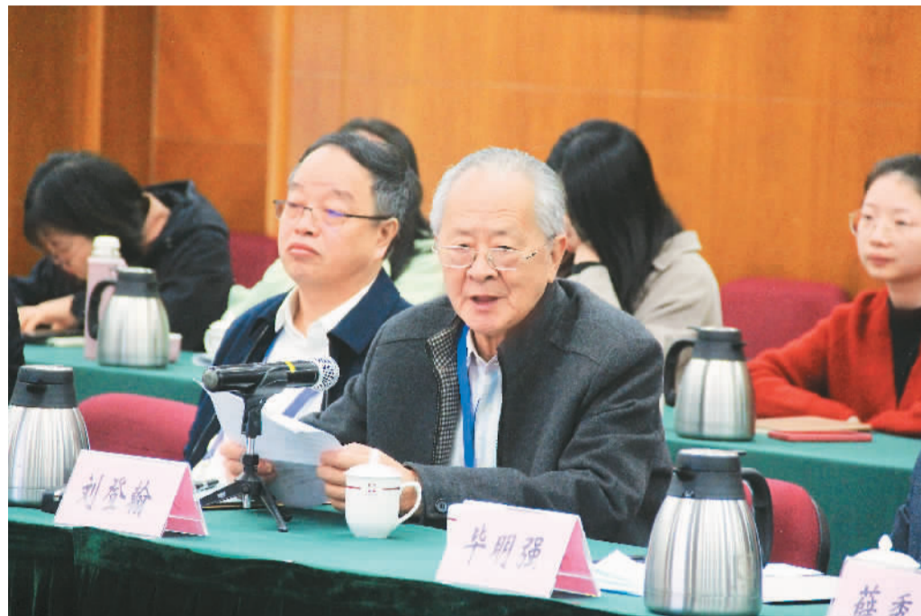
二〇二一年十二月四日，「华侨华人文学与中外文明交流：理论创新与文本阐释」学术研讨会现场。