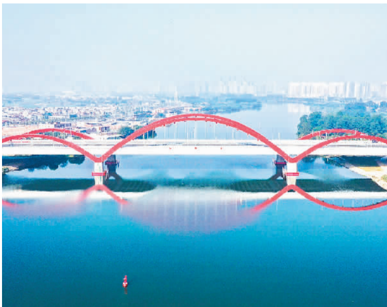
1月3日，跨越九龙江西溪的福建省漳州市东环城路马洲大桥正式通车，成为厦门通往漳州主城区的又一通道，是目前国内已建成最宽的中承式钢拱桥。图为马洲大桥。

2014年初，在俄罗斯索契，习近平总书记第一次向巴赫讲述了这一考虑：“我们申办冬奥会的最大目的，就是在三亿人中推广普及冰雪运动，推动中国冰雪运动跨越式发展。”这席话，抓住了奥林匹克精神的要义。 抚今追昔，总书记感慨：“通过筹办冬奥，不仅把冰雪运动的竞技水平追上去了，冰雪运动的普及推广也追上去了，体育运动的质和量都提高了。从体育强国到健康中国，人民的健康、人民的体质、人民的幸福，都是一脉相承的。这是全面小康、全面现代化的题中之义。它的意义，小中见大。” 专项体能训练馆，运动员、教练员、服务保障人员的欢呼声此起彼伏。 习近平总书记动情的一番话，让大家心潮澎湃：“十年磨一剑，五年磨一剑，大家长时间的艰苦训练，我们的冬奥筹办工作也是长时间准备，在此一举。人生能有几回搏，拼搏是值得的。不经一番寒彻骨，怎得梅花扑鼻香？” “我们准备好了！”“中国冰雪，加油加油！”底气十足的回应声，声震云霄。 世界期待中国，中国做好了准备。