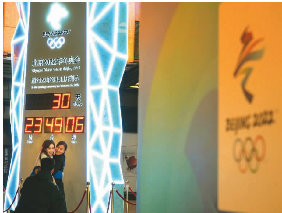
1月4日，北京2022年冬奥会迎来开幕倒计时一个月。图为人们在位于北京王府井大街的北京2022年冬奥会倒计时牌前拍照留念。

近日，中国国家主席习近平发表二〇二二年新年贺词。很多人发现，习近平主席的书架上多出了两个“小家伙”——2022北京冬奥会吉祥物“冰墩墩”和冬残奥会吉祥物“雪容融”。“冰墩墩”“雪容融”出现在镜头中，仿佛在向全球发出冰雪邀约。中国将竭诚为世界奉献一届奥运盛会。世界期待中国，中国做好了准备。