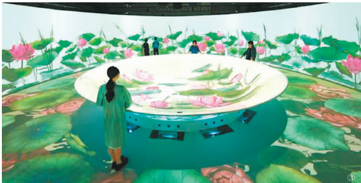
图①：家长带着小朋友在扬州中国大运河博物馆参观。 图②：“遇见敦煌·光影艺术展”现场。 图③：“‘纹’以载道——故宫腾讯沉浸式数字体验展”现场。