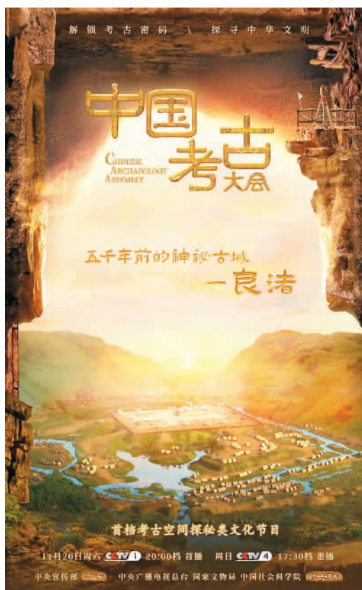
《中国考古大会》海报。