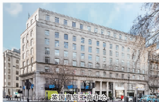
英国青岛工商中心