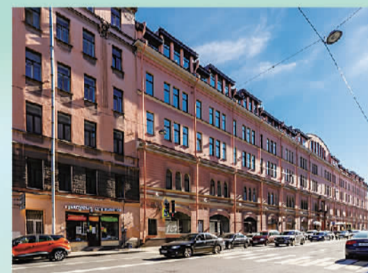
俄罗斯青岛工商中心