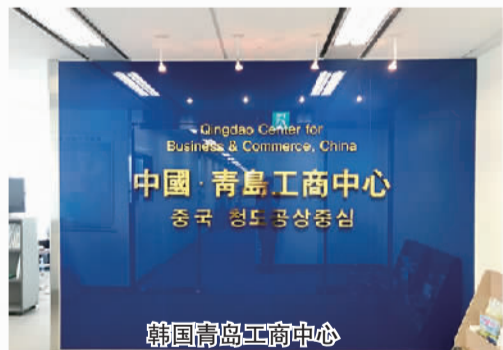
韩国青岛工商中心