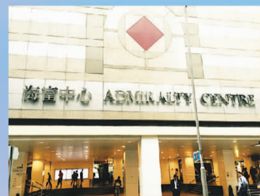
中国香港青岛工商中心