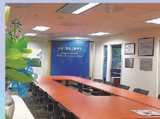
美国青岛工商中心