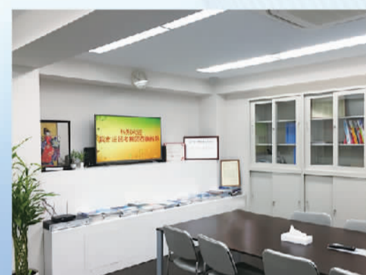
日本青岛工商中心

电话:+7 9111253522 +7 9117674432 E-mail: 18678908887@163.com gaodengpan@163.com 办公地址:俄罗斯圣彼得堡中心区起义广场商业中心 Bakunin 路5号商务中心三楼