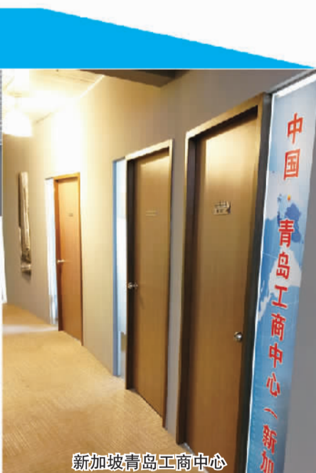
新加坡青岛工商中心