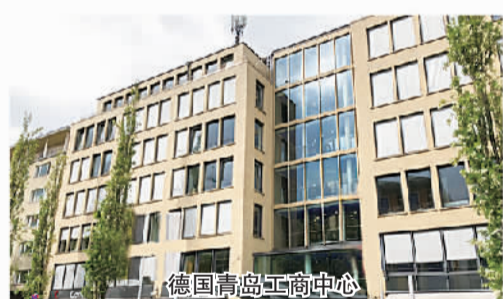
德国青岛工商中心