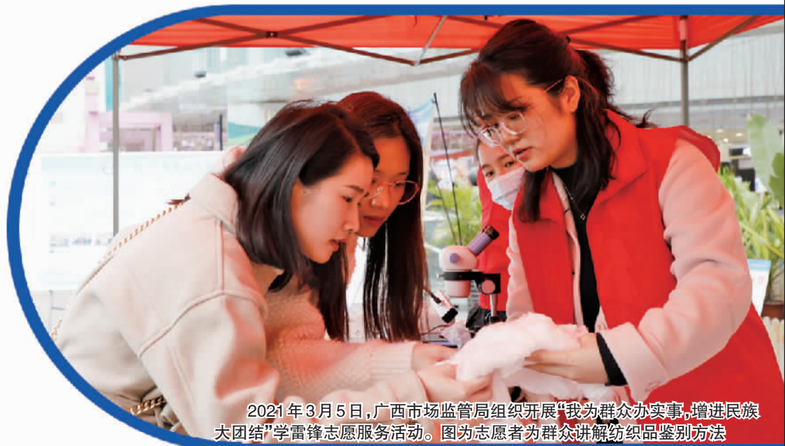
2021年3月5日,广西市场监管局组织开展“我为群众办实事,增进民族团结”学雷锋志愿服务活动。图为志愿者为群众讲解纺织品鉴别方法