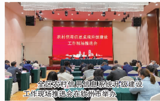
全区农村信用信息系统升级建设工作现场推进会在钦州市举办