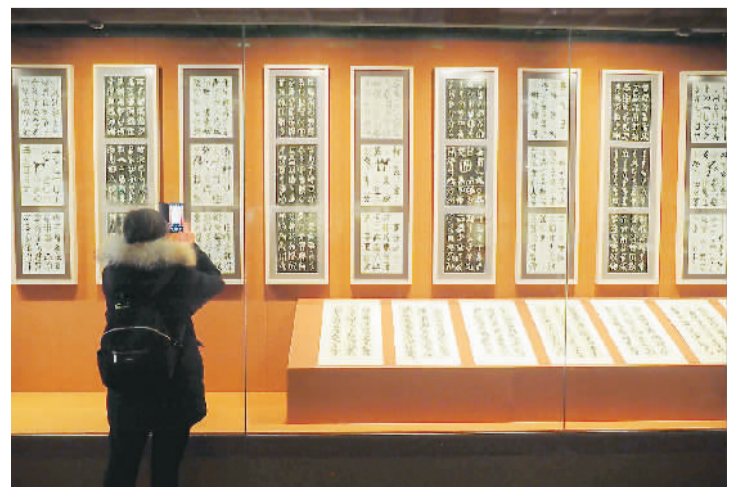
“纳天为书——韩美林天书艺术故宫展”现场。