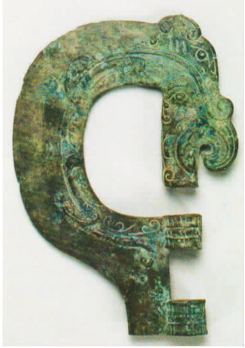
▲西周半环形龙纹铜钺。