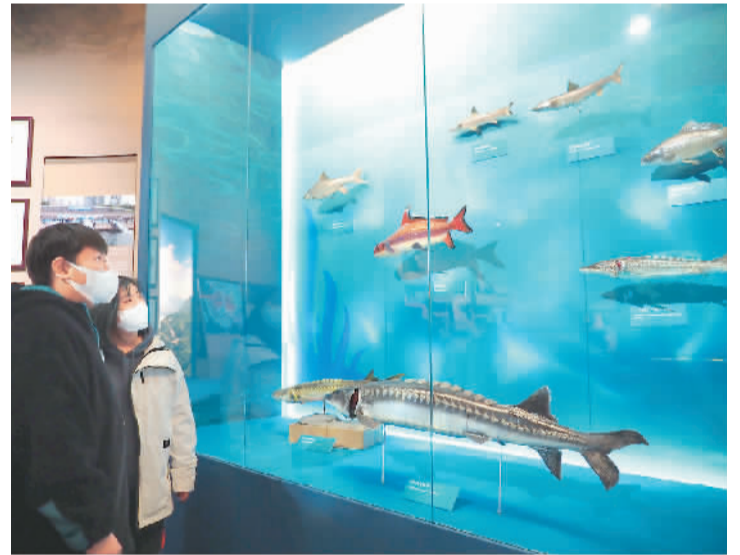
参观者欣赏长江鱼类标本。

第五部分“大江安澜丰碑立”，回顾了从古至今对长江水患的治理，重点介绍三峡工程的巨大成就，以及在全面推动长江经济带发展的历史起点上，长江大保护的成就与展望。展厅里的三峡大坝模型吸引了许多观众驻足拍照。长江流域文物保护和生态保护的成果展示，更令人对长江的未来充满期待。