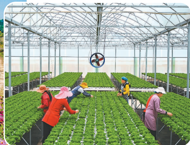
▲ 家门口就业，工作中增收。搬迁群众在云南省会泽县道成公司蔬菜大棚里劳作。