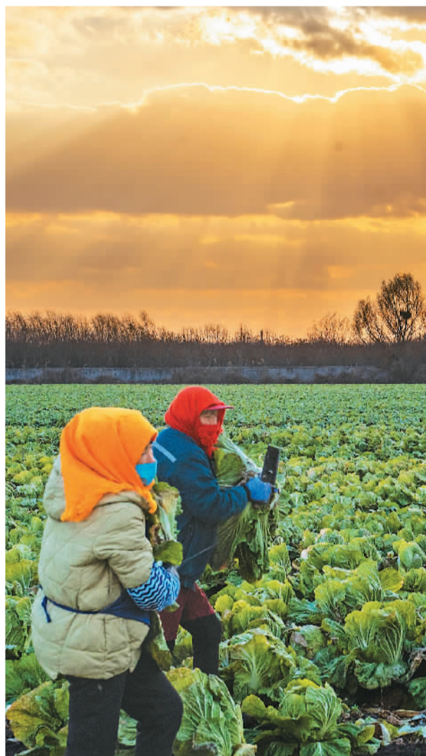
▼ 山东省青岛市胶州市打造高效绿色蔬菜种植示范基地，有效带动农户增收。图为农民忙着收获大白菜。