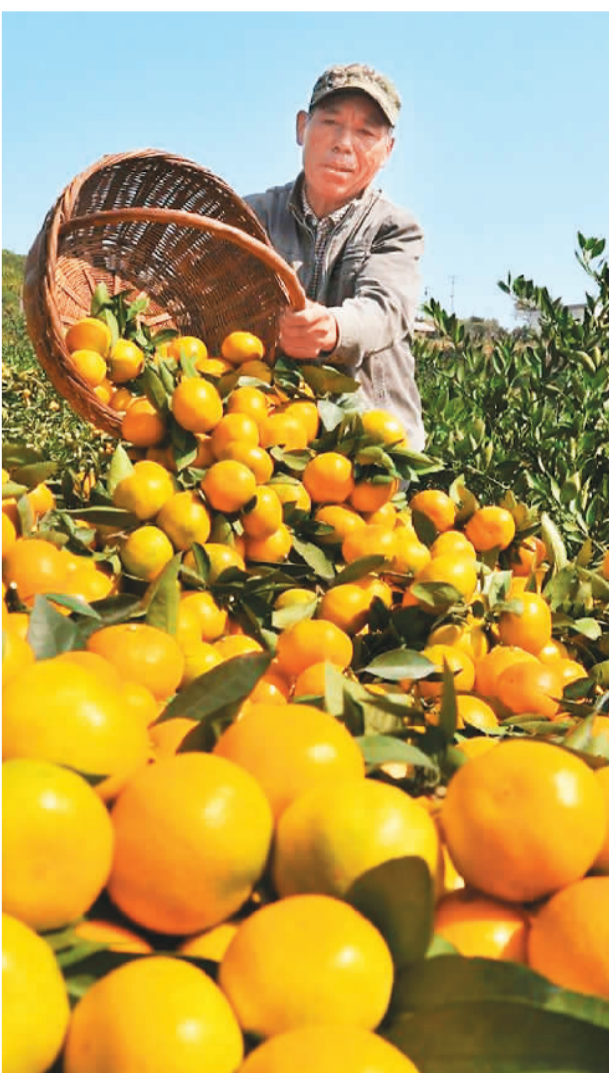
▼ 又是一年柑橘丰收时。湖北省丹江口市习家店镇引进优质新品种，橘子个头大，成熟快，产量高。图为村民在收获柑橘。