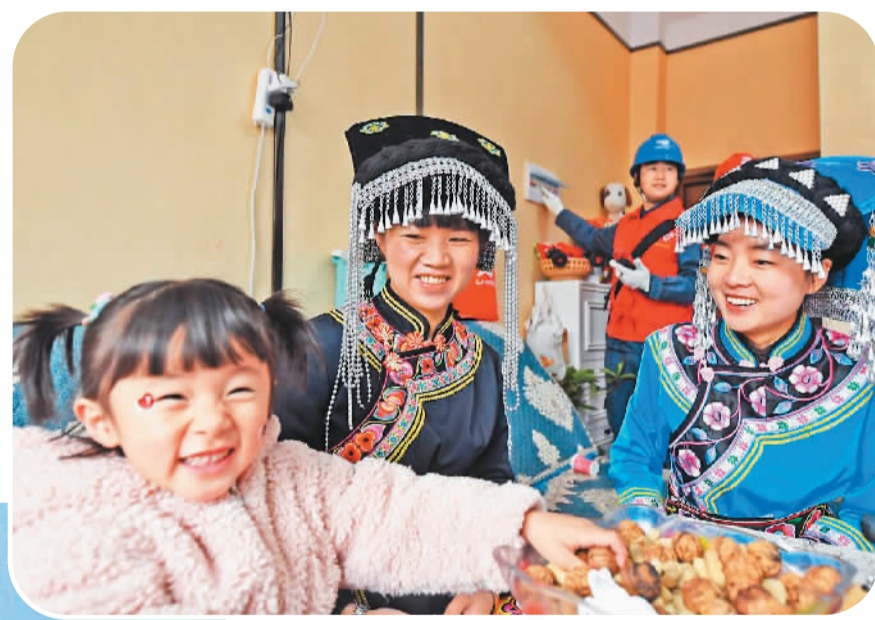
▲ 搬得舒心，住得安心。贵州省六盘水市海坪村彝族居民喜迁新居，南方电网六盘水供电局“黔电驿站”工作人员帮助检查处理用电安全隐患。

我国脱贫攻坚战已经取得了全面胜利。脱贫摘帽不是终点，而是新生活、新奋斗的起点。一年来，各地干部群众紧握乡村振兴“接力棒”，满怀信心开启新征程，努力克服疫情、灾情等风险挑战，继续推进高质量发展和群众生活改善。在广袤的中国大地上，农民富、产业兴、乡村美的画卷正在徐徐铺展。