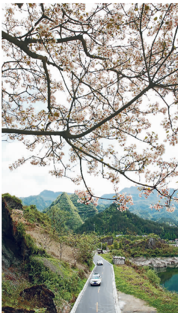
▲ 重庆市黔江区加大农村“四好公路”建设力度，一条条连接山村的公路成为“乡村振兴路”。图为车辆行驶在桐子花掩映的公路上。