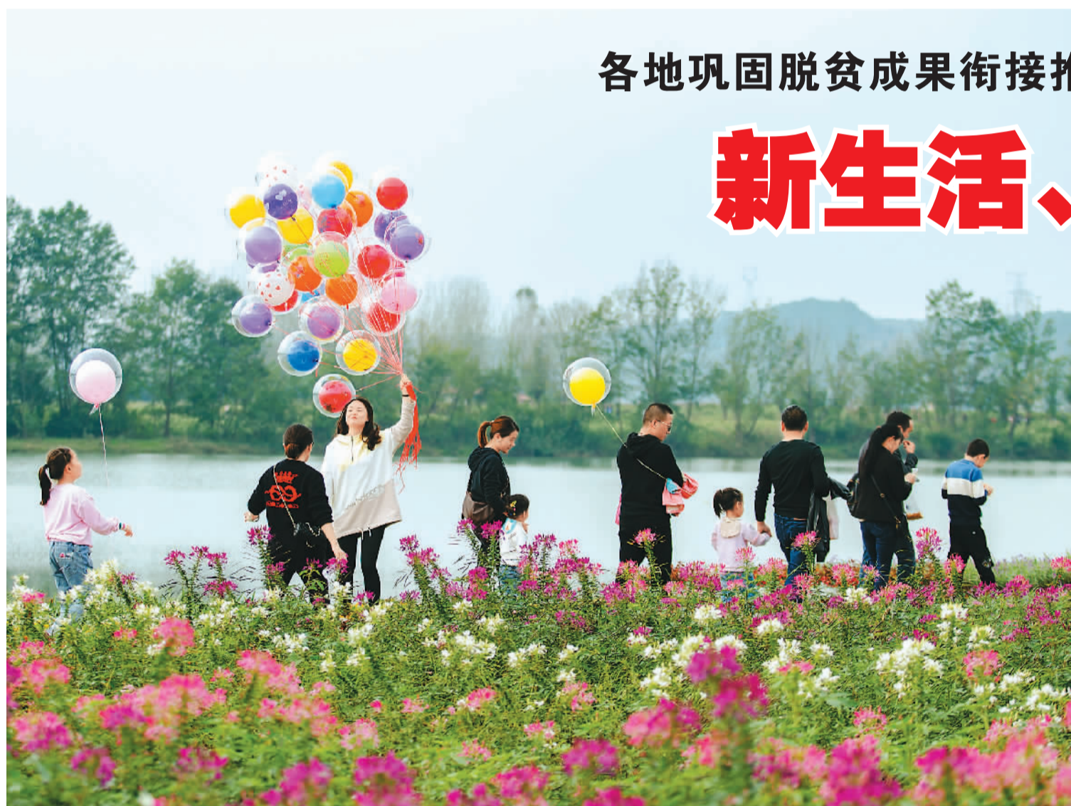
▲ 扮靓环境，引来游人。四川省射洪市广兴镇双江村通过发展休闲农业、乡村旅游等产业，推动乡村农旅融合发展。图为游客在双江村艺术花海景区赏花游玩。

我国脱贫攻坚战已经取得了全面胜利。脱贫摘帽不是终点，而是新生活、新奋斗的起点。一年来，各地干部群众紧握乡村振兴“接力棒”，满怀信心开启新征程，努力克服疫情、灾情等风险挑战，继续推进高质量发展和群众生活改善。在广袤的中国大地上，农民富、产业兴、乡村美的画卷正在徐徐铺展。