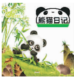
左图为《熊猫日记》AR版封面