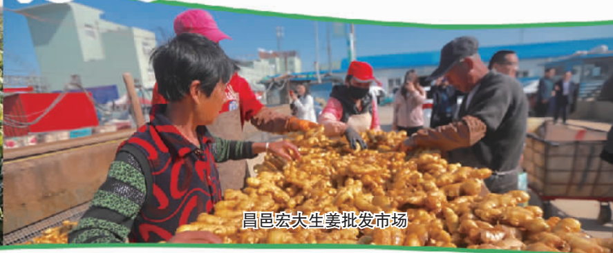
昌邑宏天生姜批发市场