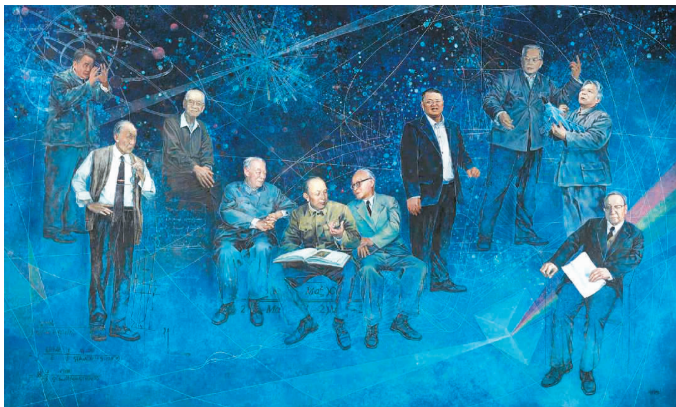
▲ 国家的脊梁 (油画) 董卓