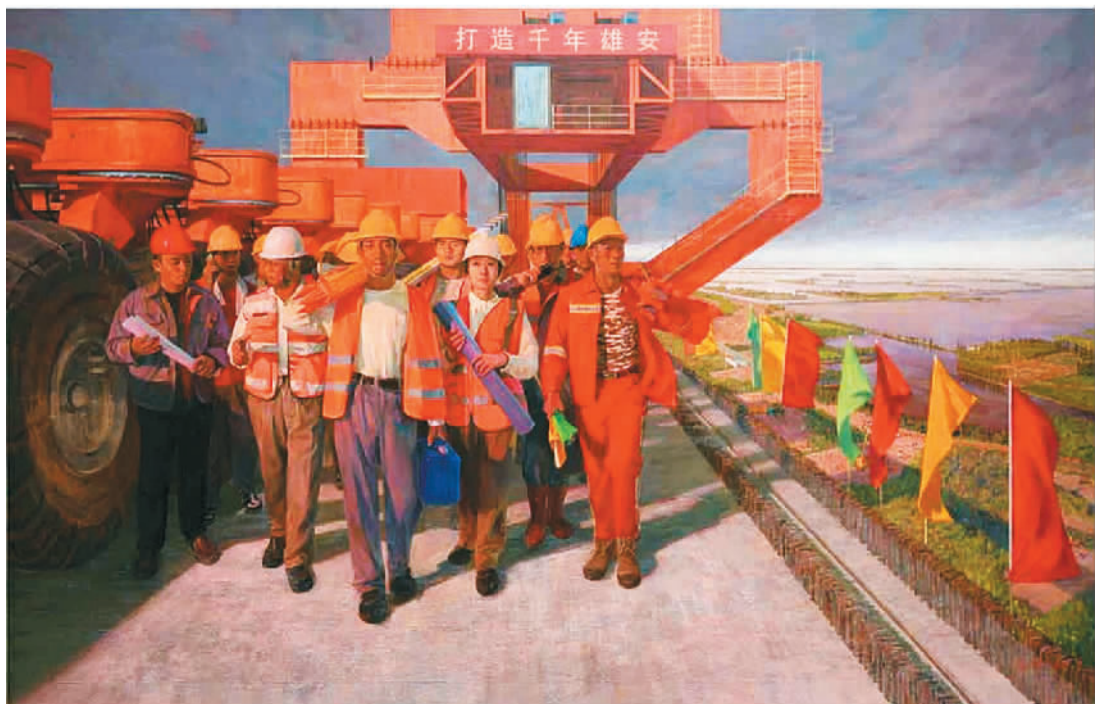
▲ 唱响明天——打造千年雄安 (油画) 马佳伟