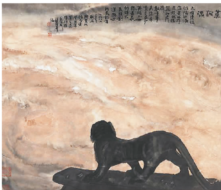
▲ 黄河魂 (中国画) 周韶华