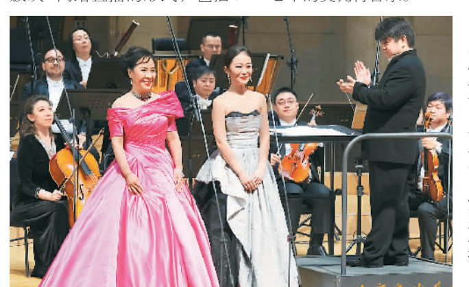
莫扎特音乐会现场。

活动从当天早9:30到晚上9:30，采取12小时现场演出+电影放映+网络直播的形式，包括6