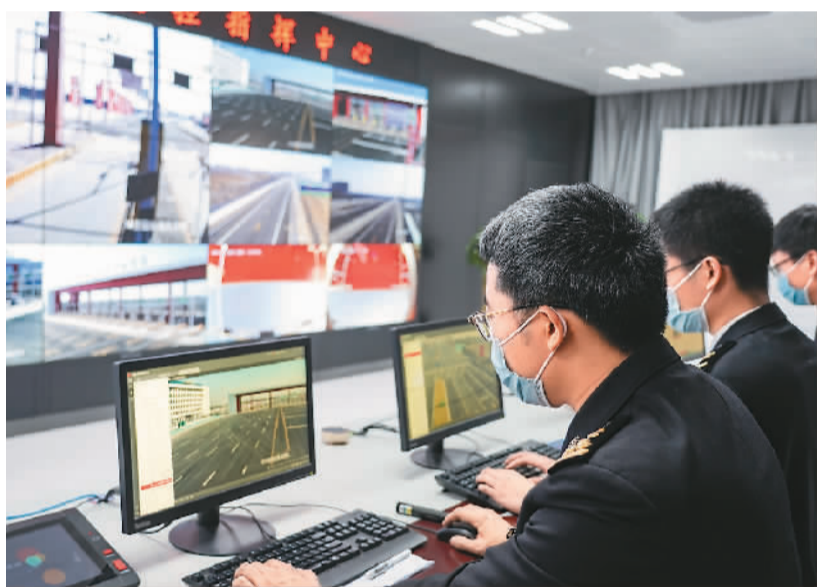
12月20日，北京大兴国际机场综合保税区(一期)正式通过国家验收。图为在综合保税区监控指挥中心验收现场，海关关员演示操作监控指挥设备。

新华社北京12月21日电(记者杜海涛)20日，全国首个也是唯一一个跨省市综合保税区——北京大兴国际