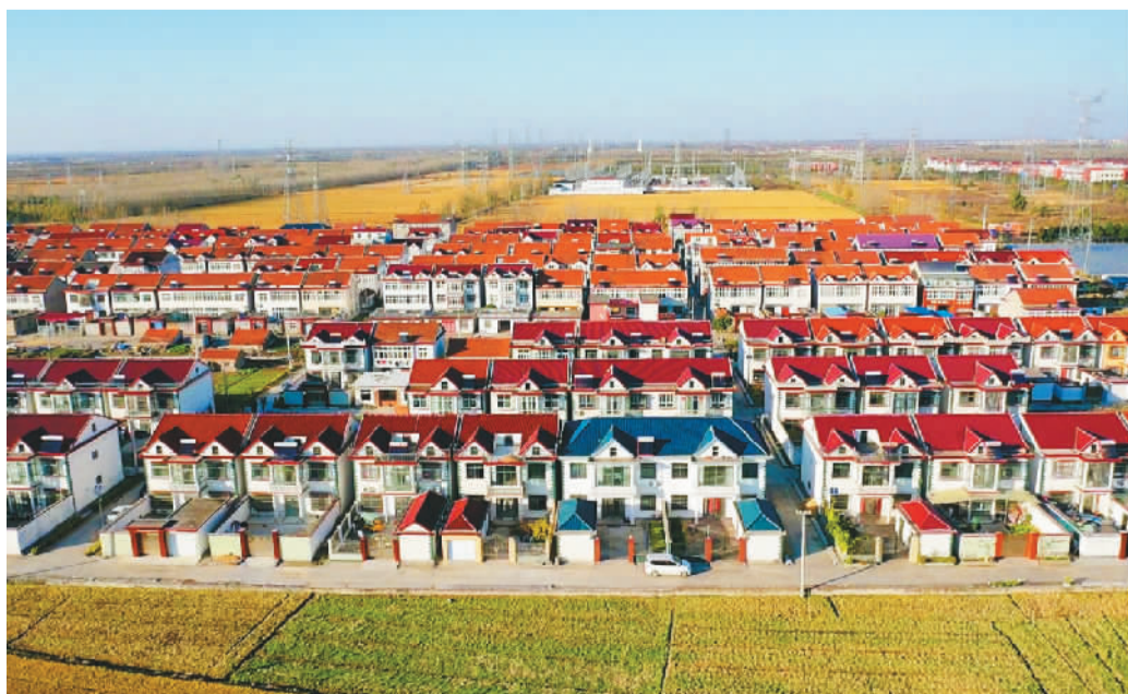
江苏连云港高新区新浦工业园积极改善农村人居环境，完善农村河道、道路交通、绿化美化、环境保护、公共设施等综合管护体系，村容村貌焕然一新。图为干净整洁的新浦工业园道口新村。