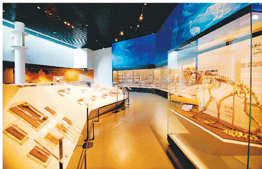
周口店北京人遗址博物馆第一展厅。