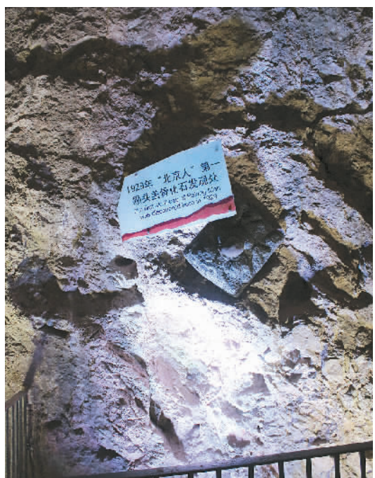
“北京人”第一颗头盖骨化石发现处。

1921年，时任中国政府矿政顾问的安特生及其助手来到周口店龙骨山试掘，发现了一颗人类牙齿化石。经测定，其年代为距今50万年左右，