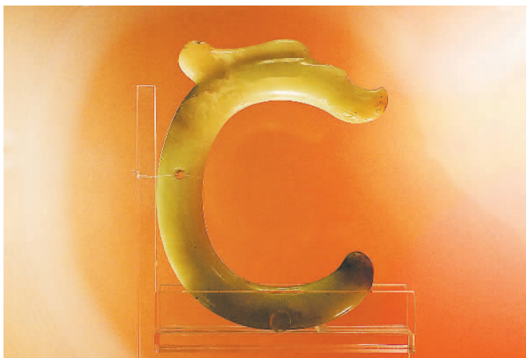
红山文化黄玉C形龙。

第二单元“敬神娱人”主要展示与祭祀有关的文物。红山文化和良渚文化都发现了规模宏大的祭坛，通过祭坛遗址及相关遗存可以了解当时的社会制度和先民们的原始信仰。除祭坛外，还发现了大量动物形器，这些器物寄托了先民们对动物某些能力的崇拜，也体现了独特的审美意识。展厅里，独具特色的红山文化黄玉C形龙，象征天地贯通的良渚玉琮，造型生动的玉鸟、玉鸮等，带领观众走近先民们丰富的精神世界。