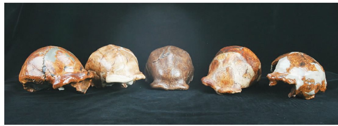
“北京人”头盖骨化石模型。