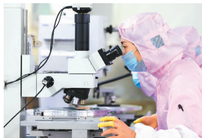
江苏省宿迁市积极实施专精特新“小巨人”企业培育计划,引导中小企业加大研发投入,提升企业创新能力。图为该市泗洪经济开发区一家制造芯片企业的工人正在车间忙碌。