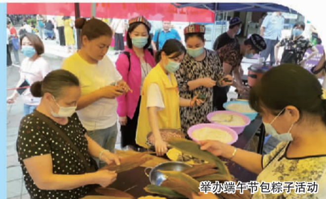
举办端午节包粽子活动

广西壮族自治区桂林市是著名的风景旅游城市，不断吸引各地群众前来旅游、经商。到2019年底，桂林城区总人口804480人(除临桂区)，少数民族人口占12.20%，55个少数民族居民在桂林共居共处。