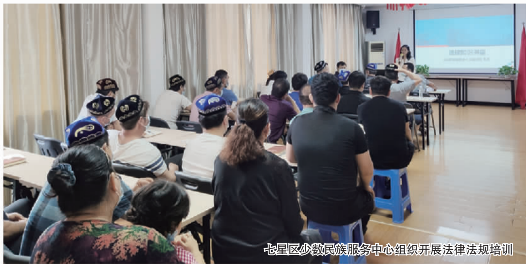
七星区少数民族服务中心组织开展法律法规培训