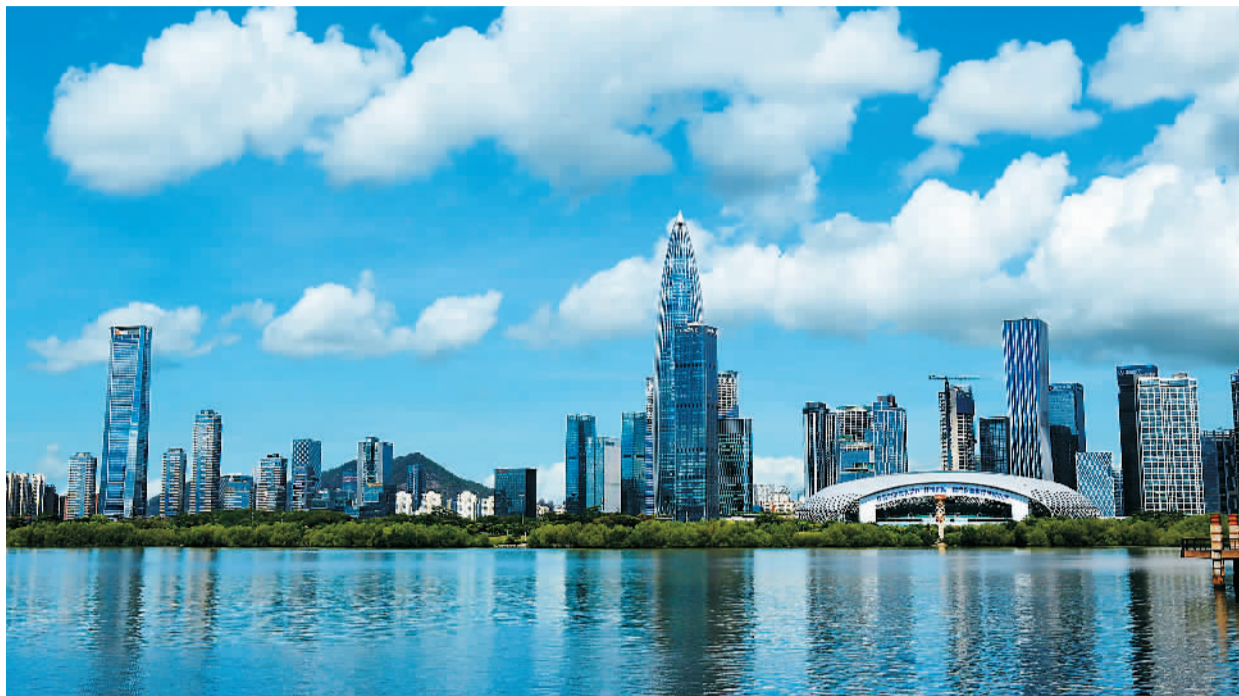
广东深圳湾公园位于深圳市福田区，地处深圳湾北岸、西岸海岸，是一处非常漂亮的滨水休闲带景观，吸引无数来自全国各地的游客前往旅游休闲。

经过多年城市发展，如今，深圳已有大大小小的公园1200多座，有“千园之城”的称号。除了遍布社区周围的社区公园，还有综合公园、郊野公园，各有特色。例如，喜爱观鸟的可以去红树林公园，喜爱赏花的可以去流花山