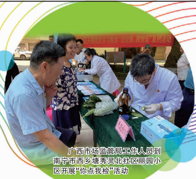
广西市场监管局工作人员到南宁市西乡塘秀灵北社区丽园小区开展“你点我检”活动