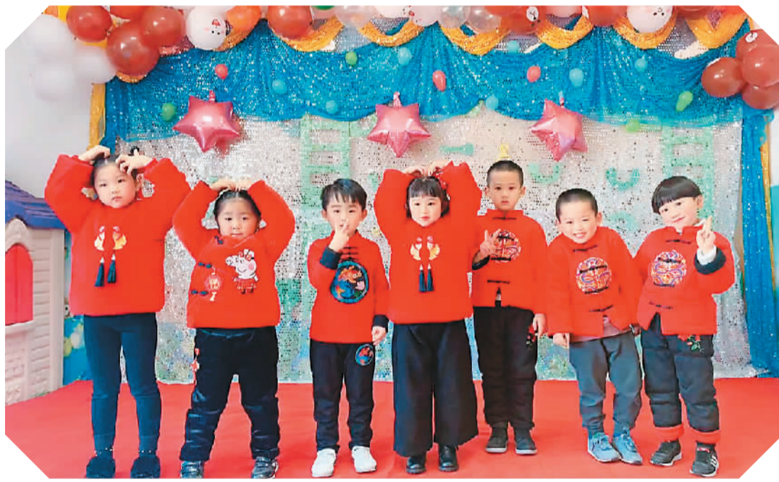
中意学校的学生参加学校组织的文化活动。

疫情发生之前，我原本计划在另一座城市开设一所新学校。但受疫情影响，这个计划只能暂时搁置。不过，我会继续办好中文学校。如今，我有了新的目标，那就是借助线上线下并行的方式，让生活在偏远地区的侨二代也能更好地学习中文。