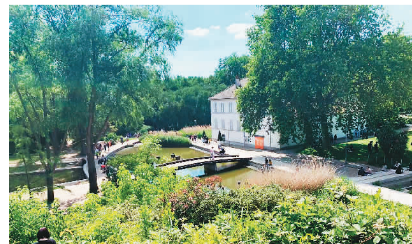
随着新冠疫苗接种推进，巴黎公园里的游人数量也逐渐多了起来。