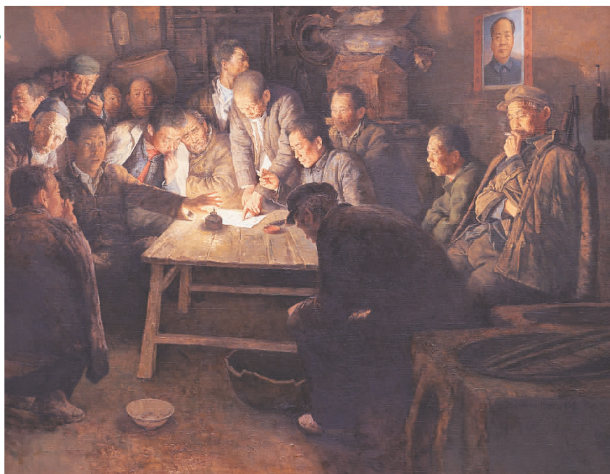
▲ 1978年11月24日·小岗（油画） 王少伦 中国美术馆藏

美术家王少伦的油画《1978年11月24日·小岗》是表现中国改革开放重要历史事件的代表性作品。作为策展人，我在策划相关主题展览时，此作是必选展品之一。这件作品曾在中国美术馆频频展出，甚至远渡重洋，在国外的博物馆、美术馆精彩亮相。很多观众通过这件杰出的油画作品，记住了1978年冬天那个改变中国农民命运的乡村之夜。