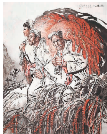
▲ 沟里人（中国画） 刘文西

生动的。淳朴木讷的陕北老人、脸上绽放高原红的陕北娃娃、窑洞外敞亮质朴的农家院落、黄土高原苍苍沟壑与汹涌激越的黄河，都在他的笔下如数家珍般地呈现。