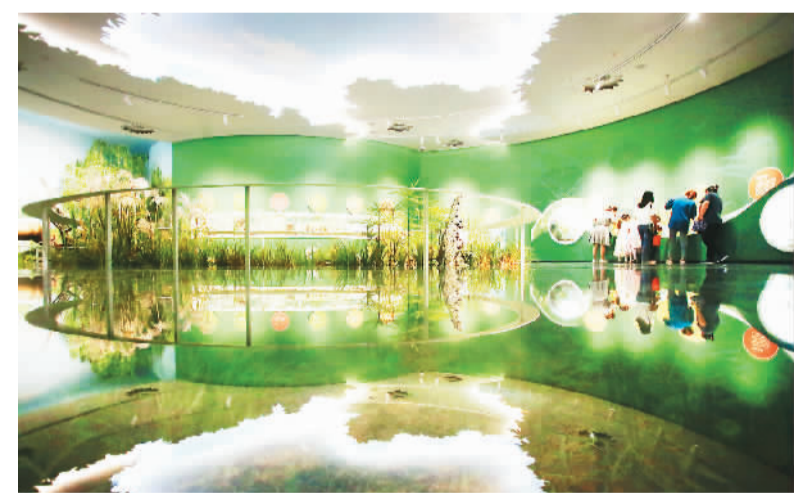
“运河湿地寻趣”展厅。

登上“沙飞船”，便可体验一场运河之旅——从杭州出发，经苏州、无锡、常州、镇江，一路航行到扬州。船身轻摇，微波将河面劈成两半，入洞穿桥，走街过镇，两岸山水与城镇风光尽收眼底。