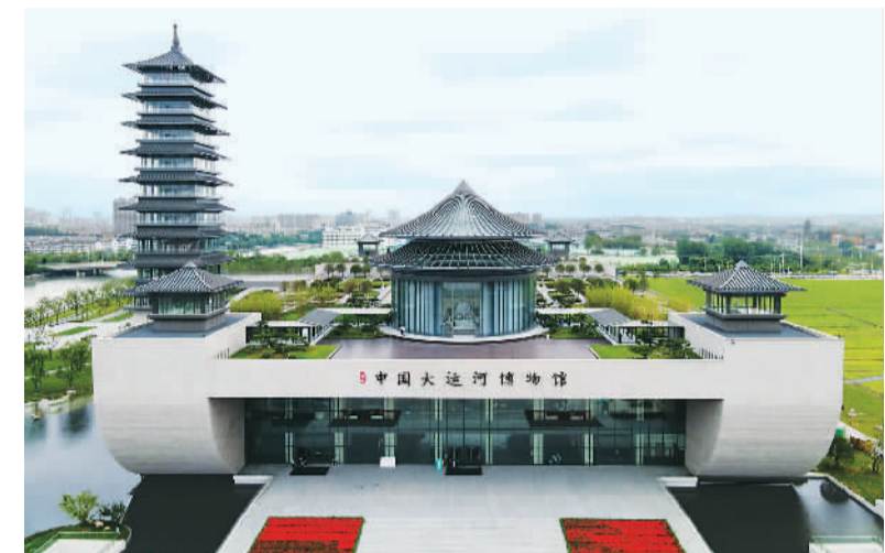
扬州中国大运河博物馆外观。

扬州中国大运河博物馆是国内首座集文物保护、科研展陈、社会教育于一体的现代化综合性运河主题博物馆，力求全方位展现大运河的历史文化底蕴和时代价值。博物馆由展馆、内庭院、馆前广场、大运河塔和今月桥五部分组成，新唐风建筑融合传统与现代之美。馆藏1万多件(套)与运河相关的文物展品，时间跨度为春秋至当代，涵盖古籍文献、书画、碑刻、陶瓷器、金属器等。