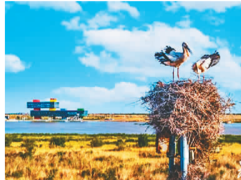
黄河三角洲是东方白鹤全球最大繁殖地、黑嘴鸥全球第二大繁殖地、白鹤全球第二大越冬地和栖息地。

黄河口国家公园划定范围35.23万公顷。其中陆域面积13.71万公顷，海域面积21.52万公顷，同时还划定国家公园核心区面积18.41万公顷，占总面积的52.26%。（孙婷婷）