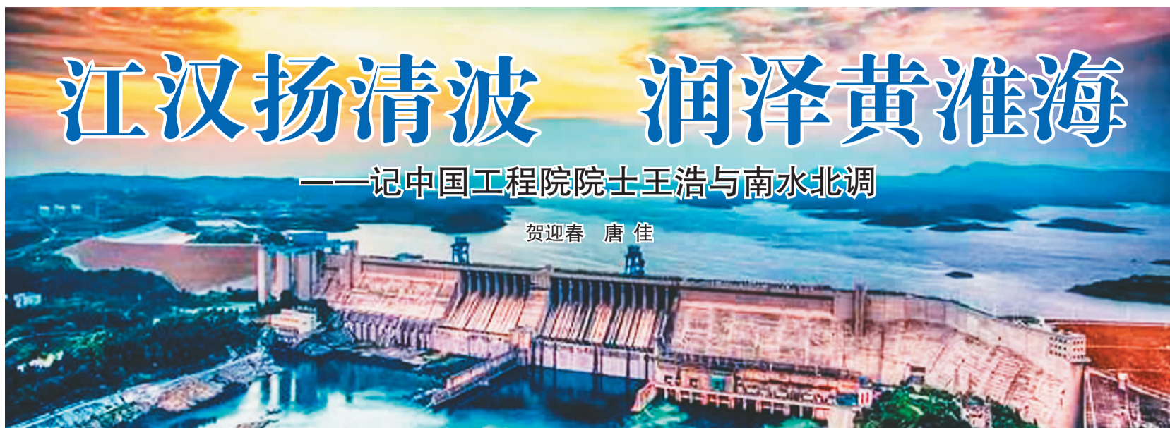
南水北调中线工程水源丹江口水库。