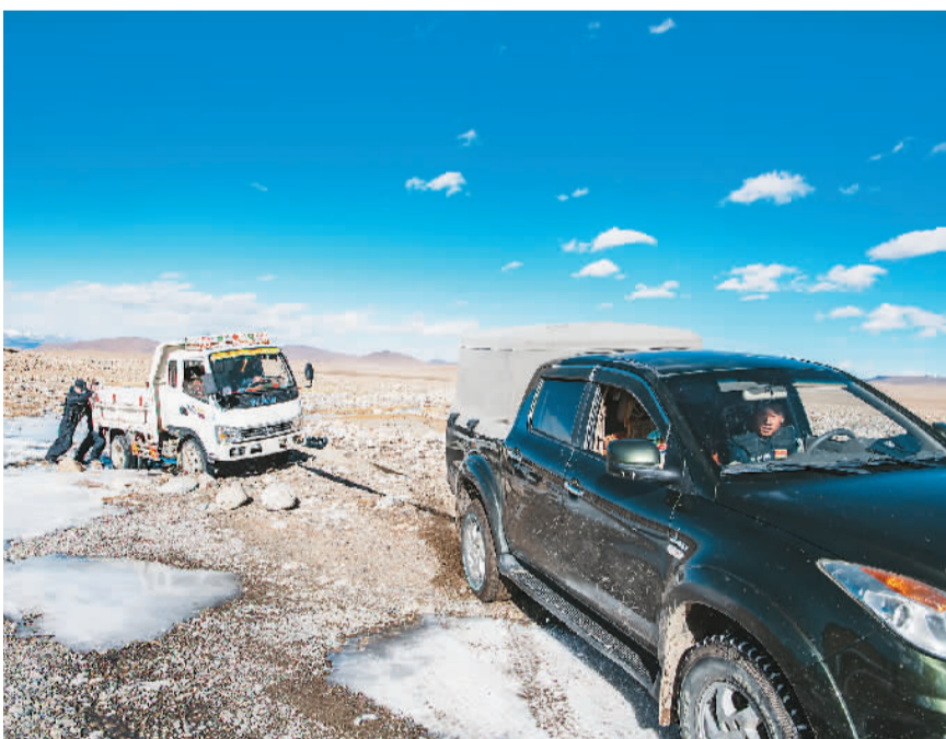
▲ 普玛江塘边境派出所的移民管理警察在巡逻途中。