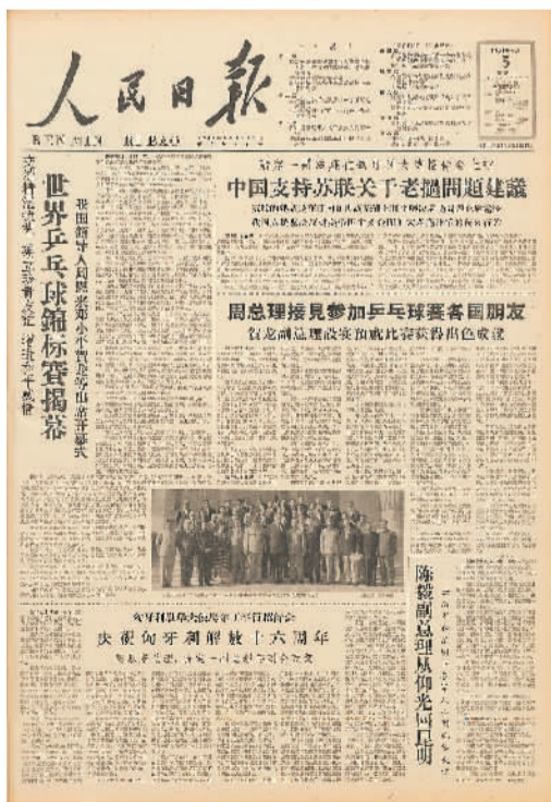
1961年4月5日的人民日报头版。

1961年世乒赛后，工人体育馆承担起国际体育馆的职责，乒乓球、篮球、排球等重大体育赛事都在工体举行。伴随改革开放，这里也成为北京重要的文化活动中枢，国内外知名歌手演唱会、国际时装周表演一场接一场，记录着中国的自信开放和人们的多彩生活。