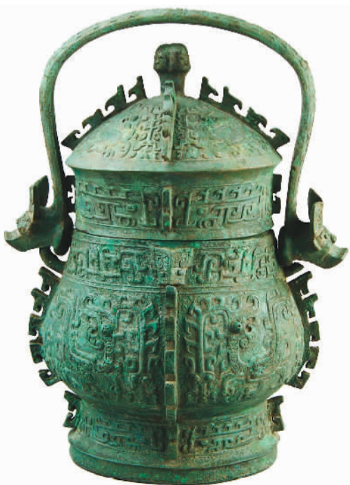
西周陆浑风纹提梁铜卣。

一问一答，引得许多参观者驻足细看：方鼎直口深腹，平折沿，方唇，口沿上有对称的圆拱形双耳。鼎下承四柱足，上粗下细，其内中空，且直通腹部。鼎腹四外壁纹饰相同，每面四隅、两侧及下部，均饰有排列整齐的乳钉纹。整器铸造精良，纹饰严谨，形制雄浑大气，极具威严之感。“大铜方鼎是商王朝的国之重器，标志着统