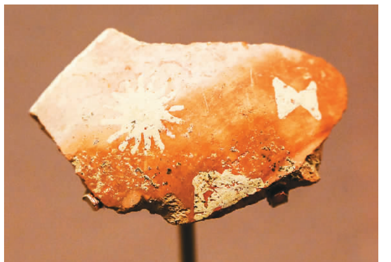
义乌桥头遗址出土的彩陶片。

展览开幕当天，“万年浙江与中华文明”学术座谈会在国家博物馆举行。会议采用线上线下相结合的方式，深入研讨上山文化作为世界稻作文化起源地的意义及其申遗的价值。