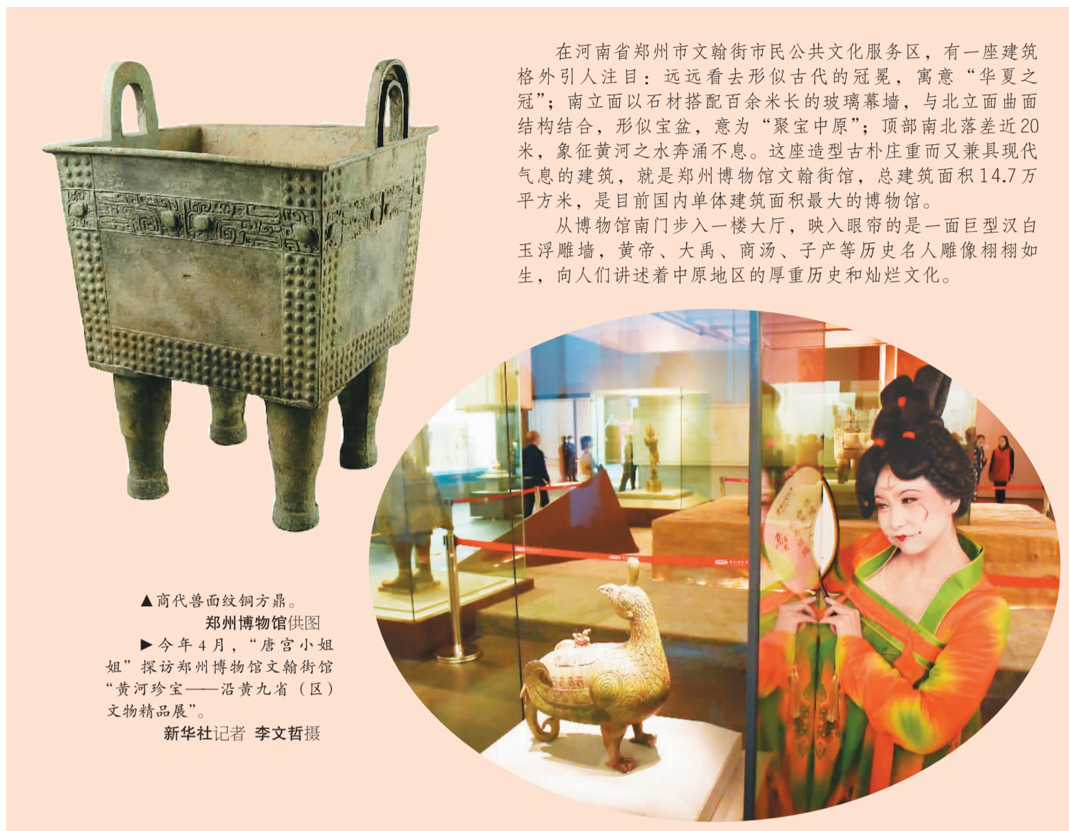
▲商代兽面纹铜方鼎。 ▶今年4月，“唐宫小姐姐”探访郑州博物馆文翰街馆“黄河珍宝——沿黄九省（区）文物精品展”。

在河南省郑州市文翰街市民公共文化服务区，有一座建筑格外引人注目：远远看去形似古代的冠冕，寓意“华夏之冠”；南立面以石材搭配百余米长的玻璃幕墙，与北立面曲面结构结合，形似宝盆，意为“聚宝中原”；顶部南北落差近20米，象征黄河之水奔涌不息。这座造型古朴庄重而又兼具现代气息的建筑，就是郑州博物馆文翰街馆，总建筑面积14.7万平方米，是目前国内单体建筑面积最大的博物馆。