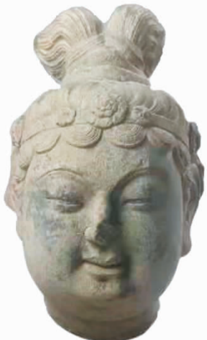
唐代菩萨石头像。

铭48字。石棺两侧浮雕“释迦牟尼涅槃十弟子送葬图”，棺身前后、下部和棺座雕有力士、伎乐人、异兽等。整个石棺雕刻精细，线条流畅，人物各具情态，逼真写实，表现出高超的艺术技巧。石棺基座上刻有修塔题记，其中有“东京左街相国寺”“东京右街开宝寺”等关于宋初国都开封城内寺院方位的记述。