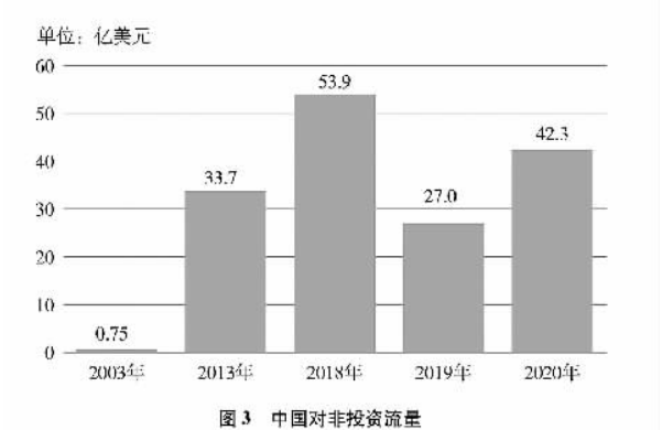
图3 中国对非投资流量

截至2020年底，中国企业累计对非直接投资超过430亿美元。中国在非洲设立各类企业超过3500家，民营企业逐渐成为对非投资的主力，聘用非洲本地员工比例超80%，直接和间接创造了数百万个就业机会。