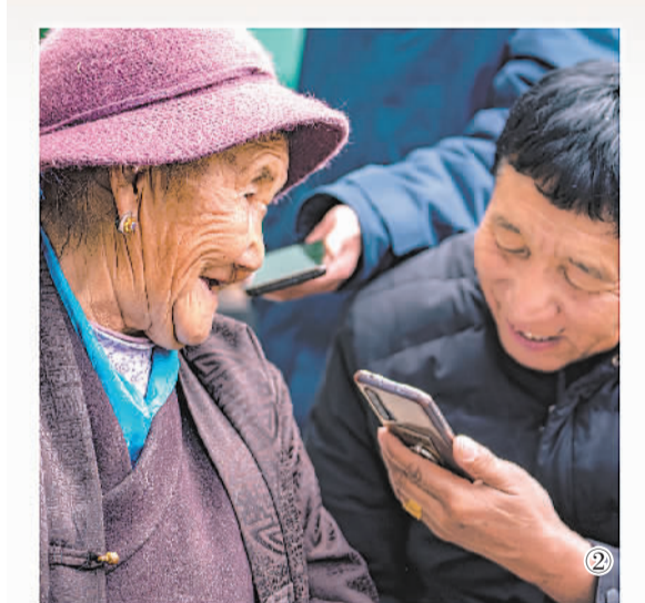
图②：西藏山南市乃东区克松社区内，村干部在给老人用手机播放音乐。