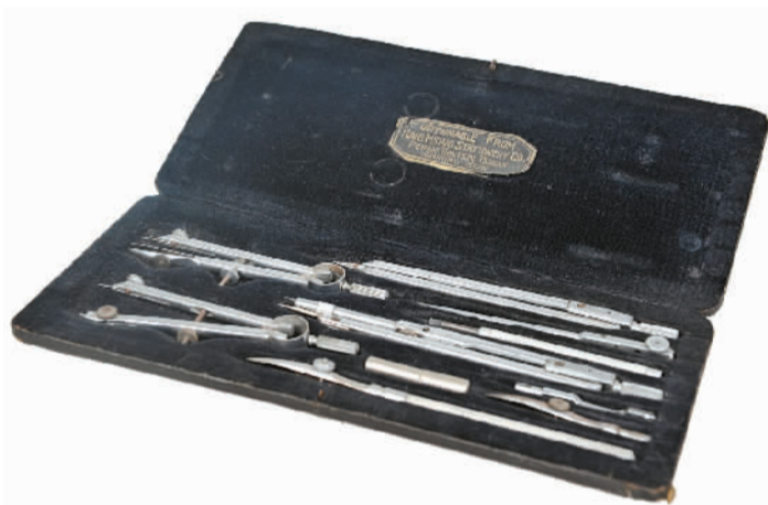
麦璇琨绘制《天津城防堡垒化防御体系图》使用的绘图仪。

麦璇琨绘制的城防图对天津解放做出了巨大贡献。1949年1月14日10时，天津城市攻坚战打响。平津战役天津前线总指挥刘亚楼率领5个纵队22个师共34万人，从东、西、南三个方向发起总攻，仅用29个小时激战便解放天津。刘亚楼在回忆这场战役时写道：“华北党组织特别是天津市地下党的同志，供给了详尽的天津敌情资料，连每一座碉堡的位置、形状、守备兵力都有具体交代。这就使我军迅速掌握了情况，因而下决心、订作战计划、部署兵力，都有了确实可靠的基础。”