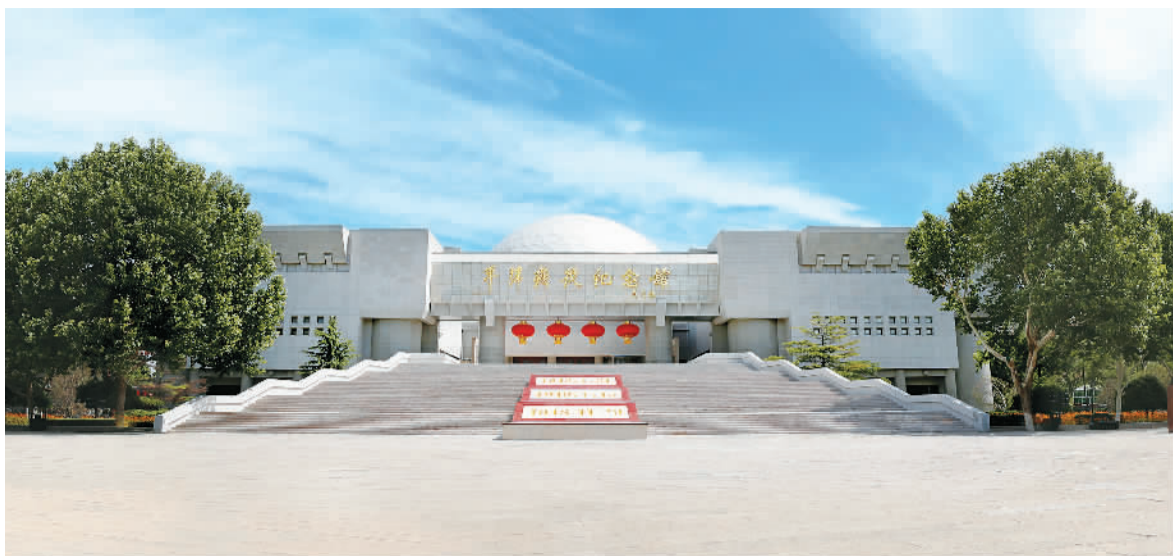
平津战役纪念馆外观。