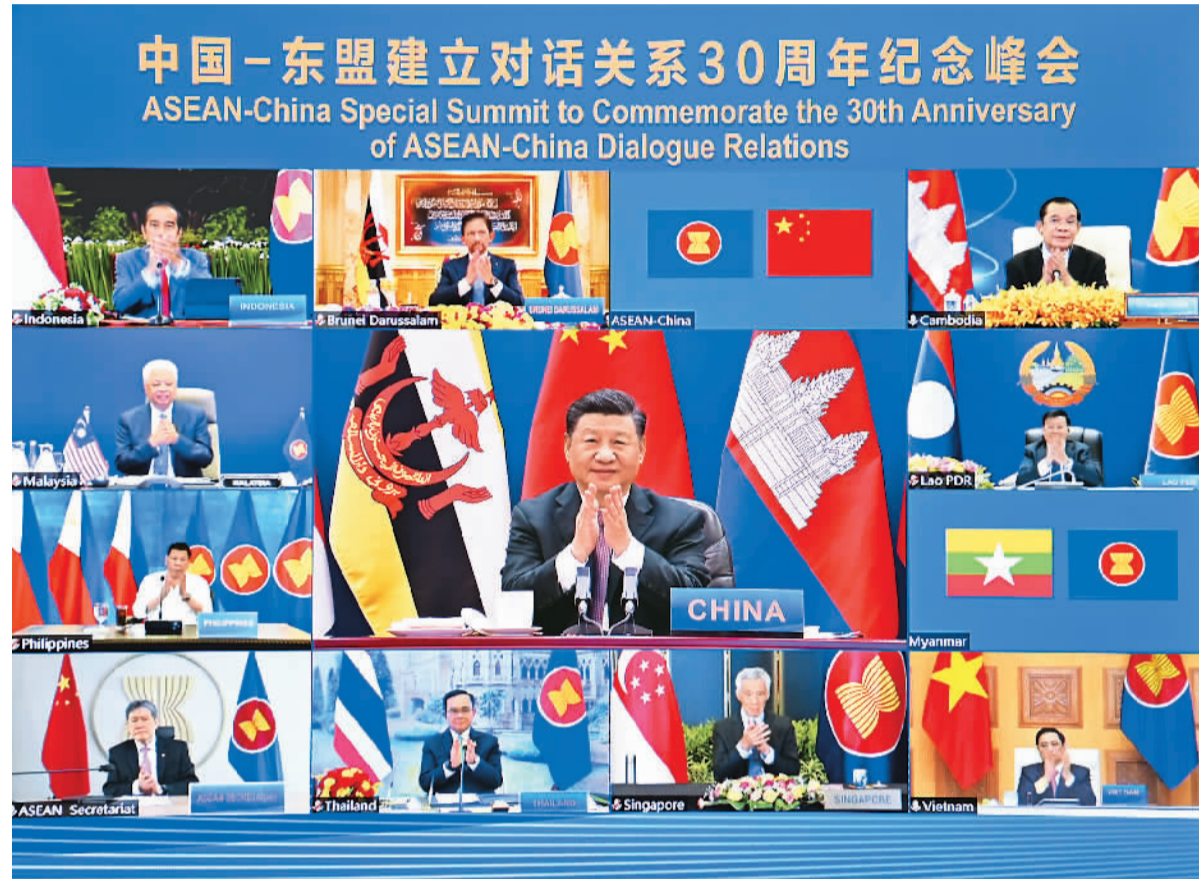
11月22日上午,国家主席习近平在北京以视频方式出席并主持中国—东盟建立对话关系30周年纪念峰会,发表题为《命运与共 共建家园》的重要讲话。中国东盟正式宣布建立中国东盟全面战略伙伴关系。

新华社北京11月22日电 (记者杨依军) 国家主席习近平22日上午在北京以视频方式出席并主持中国—东盟建立对话关系30周年纪念峰会。中国东盟正式宣布建立中国东盟全面战略伙伴关系。