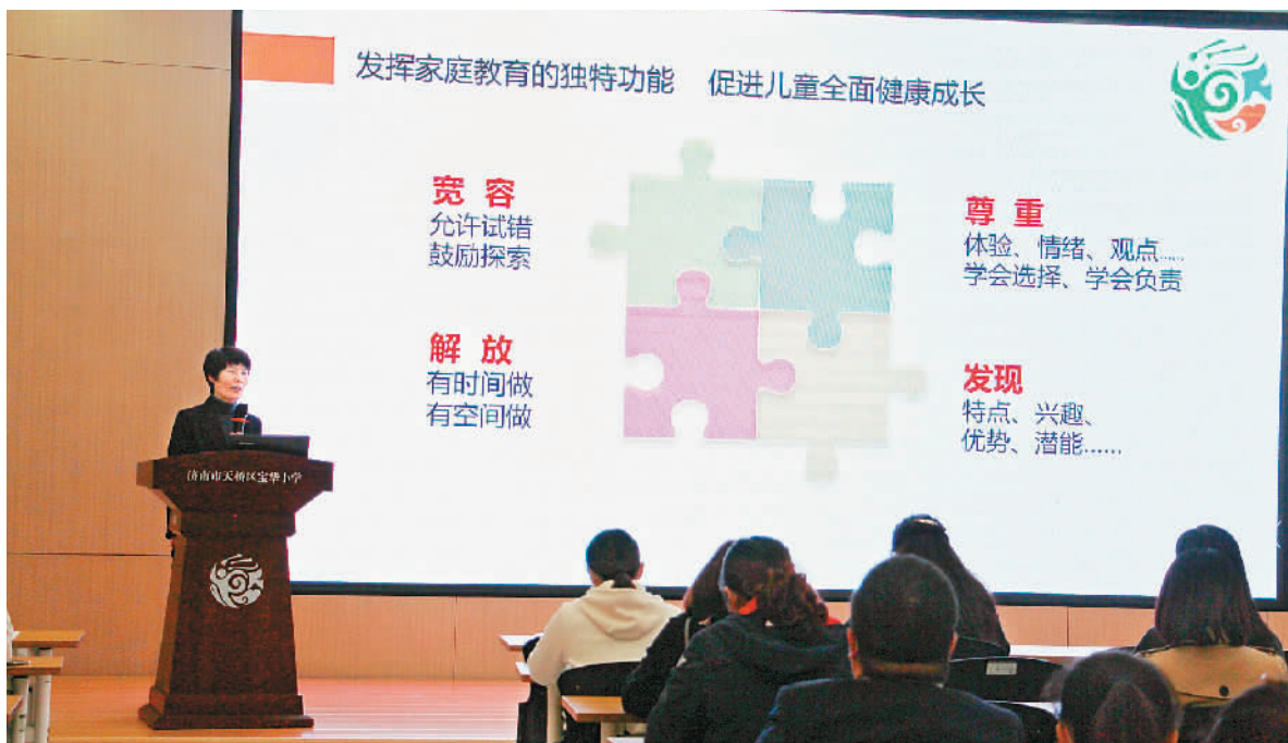
10月20日，在山东省济南市天桥区的宝华小学家长学校，老师为家长进行家庭教育指导。