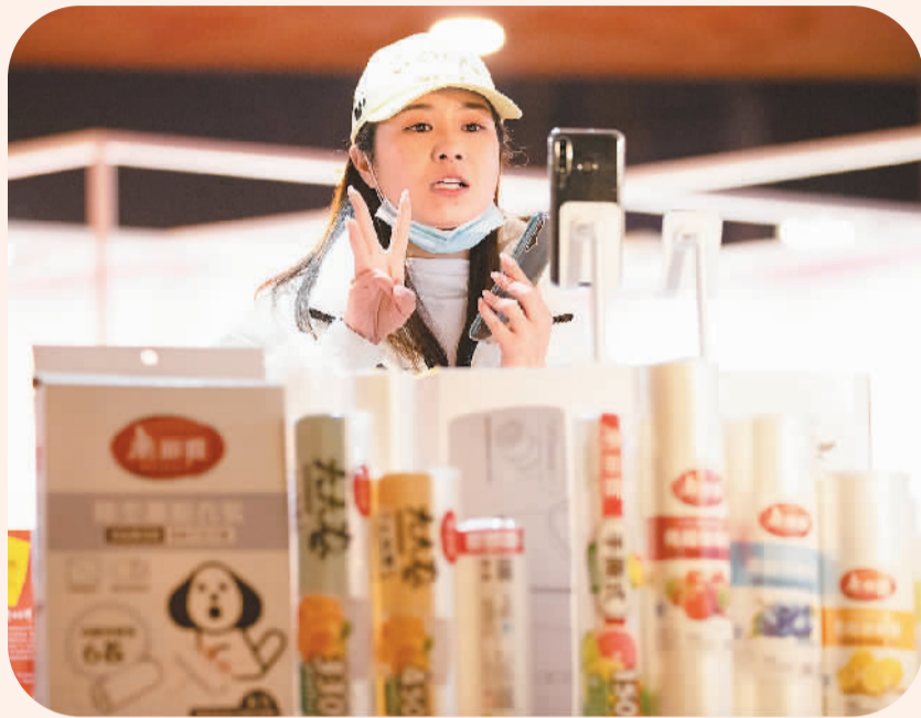
在“我要当主播 就卖成都货”2021成都·职工互联网营销直播大赛中，职工主播在网上推销产品。

在直播间购物、等快递送货上门已成为不少人的生活日常。成熟的网购体验背后，少不了互联网营销师、网约配送员等新职业从业人员的大力支持。中国信息通信研究院近日发布的《数字经济就业影响研究报告》指出，数字经济在创造新增就业、优化就业结构等方面发挥日益重要的作用，应深度挖掘数字平台灵活就业的巨大潜力。