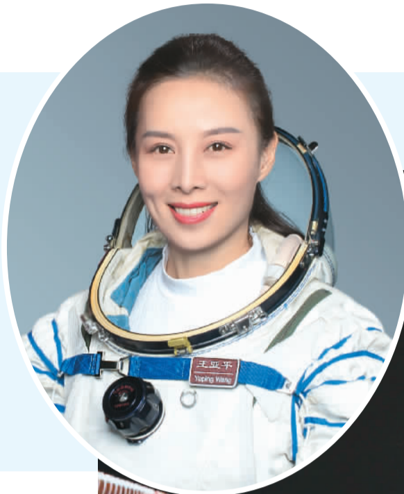
▲ 王亚平 ▼ 王亚平出舱画面

在这期间，3名中国航天员完成了出舱活动等任务。第二次进入太空的王亚平成为中国首位出舱行走的女航天员，创造了中国航天的新纪录，也为世界航天发展贡献了“她力量”。