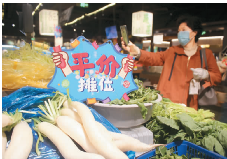
▲10月27日，市民在江苏省苏州市姑苏区一家农贸市场的“平价菜摊”上选购蔬菜。