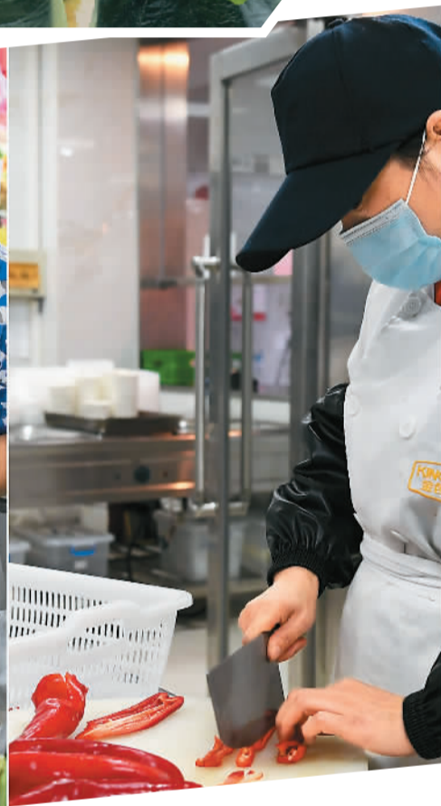
▲这组照片展示了11月4日至5日间，安徽省马鞍山市和县历阳镇太平村蔬菜基地里的辣椒从田头到餐桌的“进城之旅”。辣椒经过分销，到达农贸市场和社区菜店，最终端上合肥市民的餐桌。