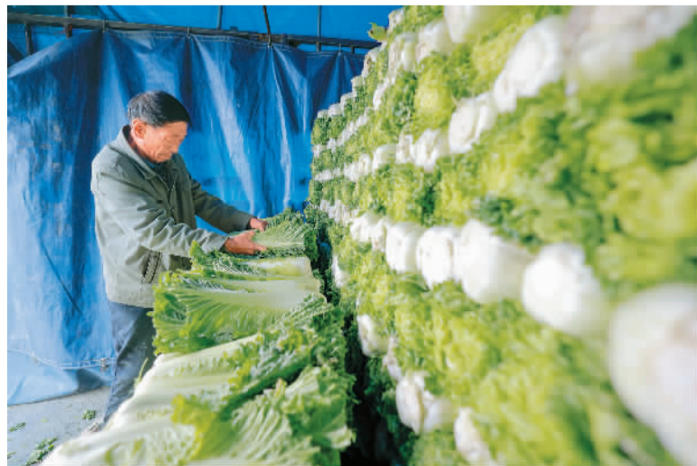
▲为应对寒潮天气，河北省唐山市丰南区各蔬菜基地的菜农抢收成熟蔬菜，保障市场供应。图为11月4日，丰南区王兰庄镇高先甸村菜农将收获的大白菜装车准备外运。