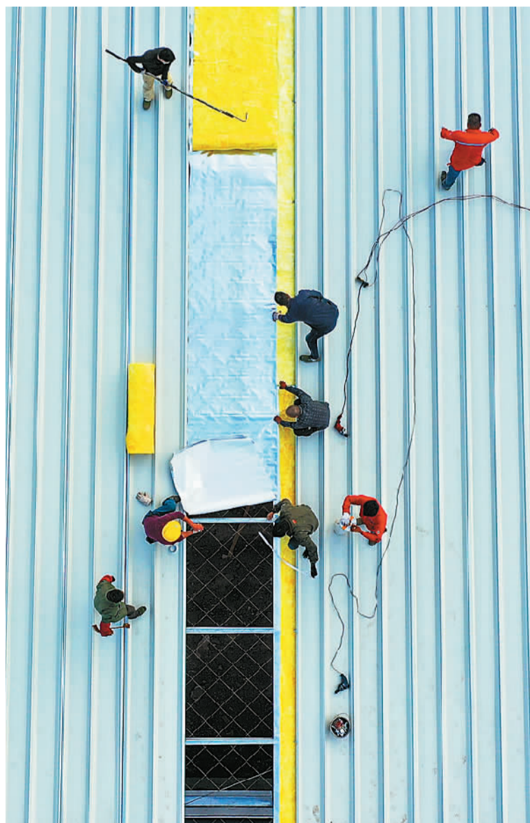
▲11月7日，在江西省赣州市会昌县九州工业基地蔬菜储存仓库，工人给厂房顶棚加盖保温棉。