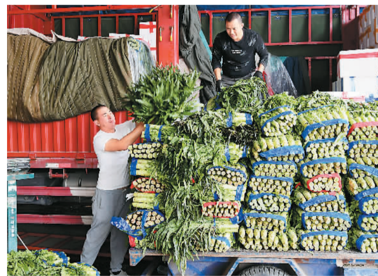
▲10月31日，浙江省金华市农产品批发市场的商户们在分拣、装卸、转运新鲜蔬菜。