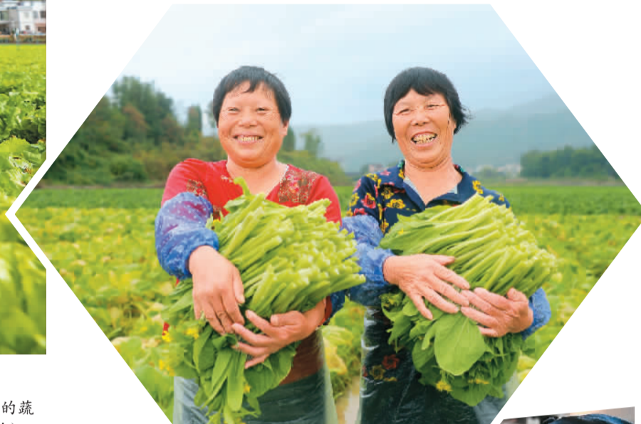
▶湖南省永州市新田县中山街道潭田村870余亩高标准农田的蔬菜丰收。图为11月5日，村民在展示采摘的菜心。