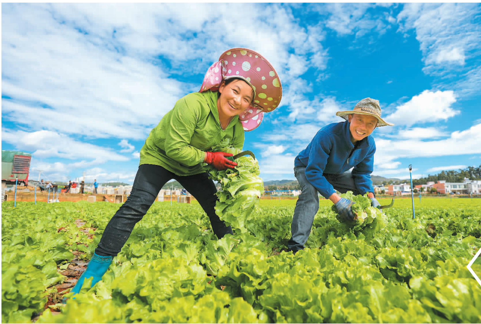
▲11月4日，云南省曲靖市陆良县芳华镇龙潭社区的露天蔬菜种植基地里，菜农正忙着采收新鲜蔬菜。

据国家发展改革委有关负责人介绍，随着各地保供稳价措施的落实，蔬菜批发和零售价格已有所回落，其中前期涨幅较大的鲜嫩蔬菜价格降幅明显。目前，蔬菜供应总量充足，居民消费有保障。