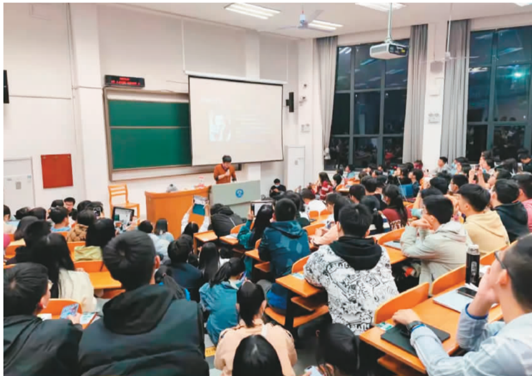
十月十七日，武汉大学一场名为《恋爱心理学》的讲座吸引了众多学生。