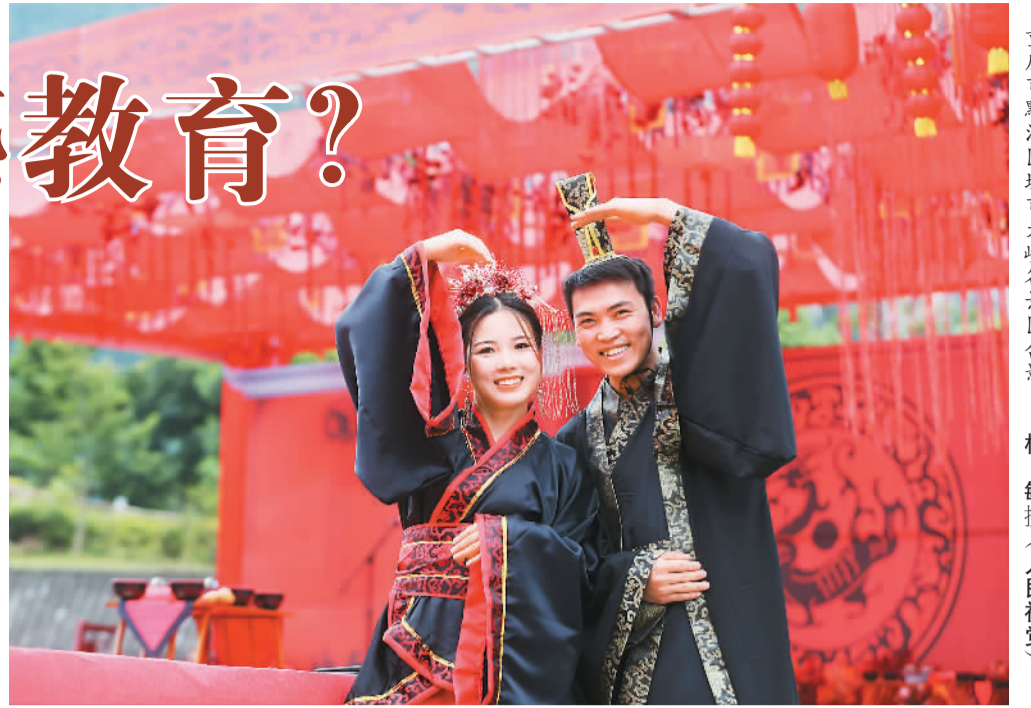
在今年六月举行的鲁渝青年婚恋交友活动中，一对新人在重庆市黔江区城市大峡谷景区合影。