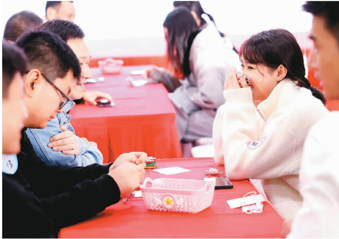
十月二十日，中国铁路上海局集团有限公司上海动车段百余名单身青年员工参加相亲活动。