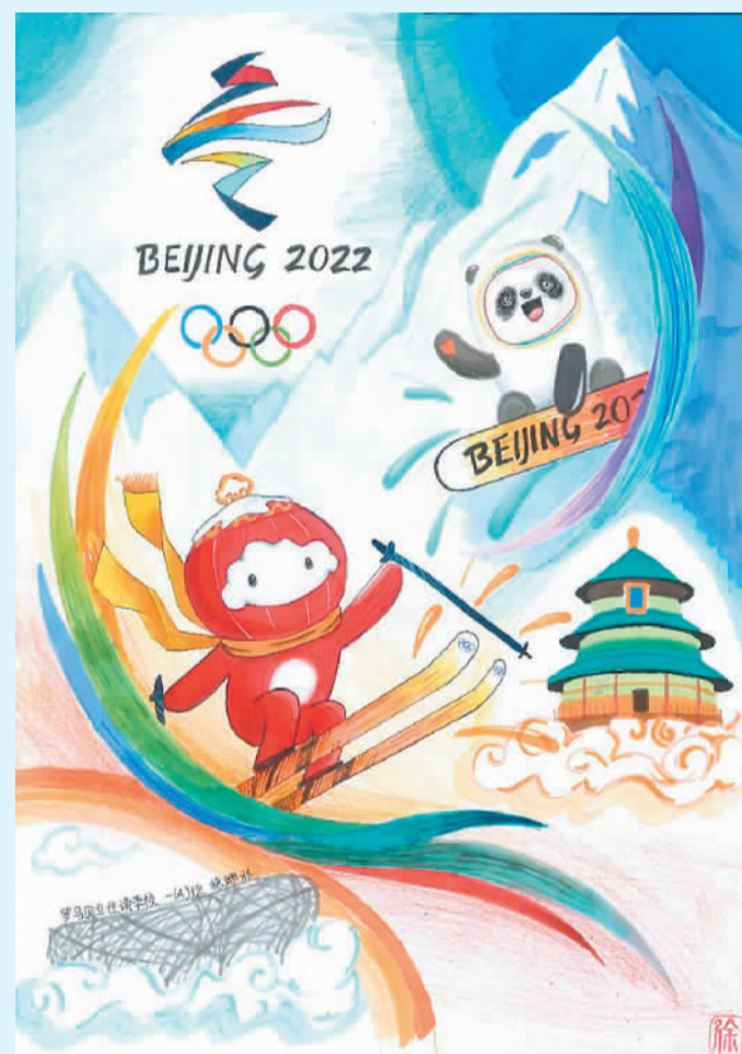
徐璐华作 (寄自意大利)