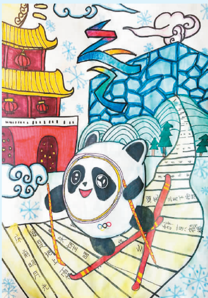
郭米娅作 (寄自爱尔兰)