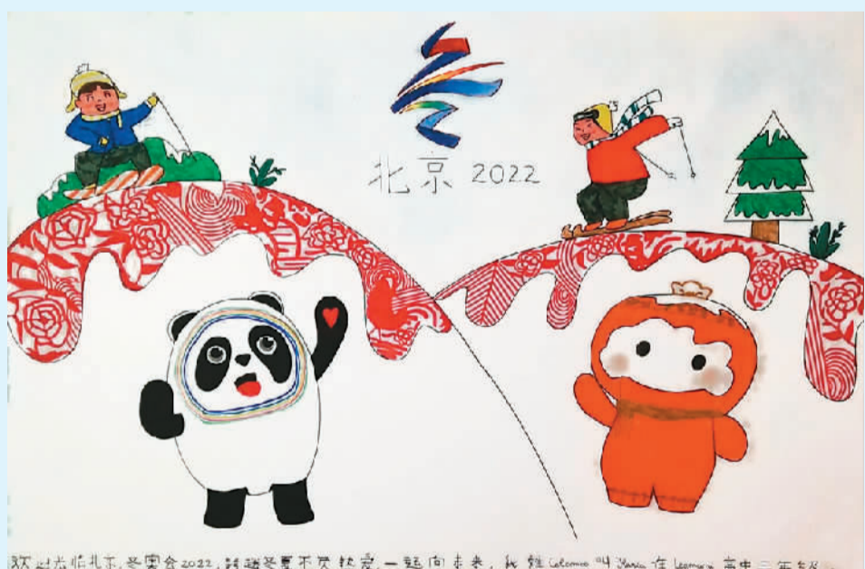
科伦伯·莱利亚作 (寄自意大利)