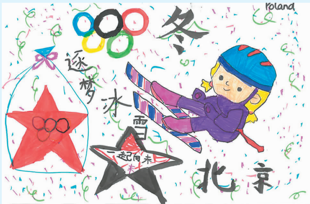
玛丽亚·祖瓦克作 (寄自波兰)

日前，由中外语言交流合作中心主办的欧洲地区中小学生“画冬奥，学中文”手抄报征集活动优秀作品展正式上线。