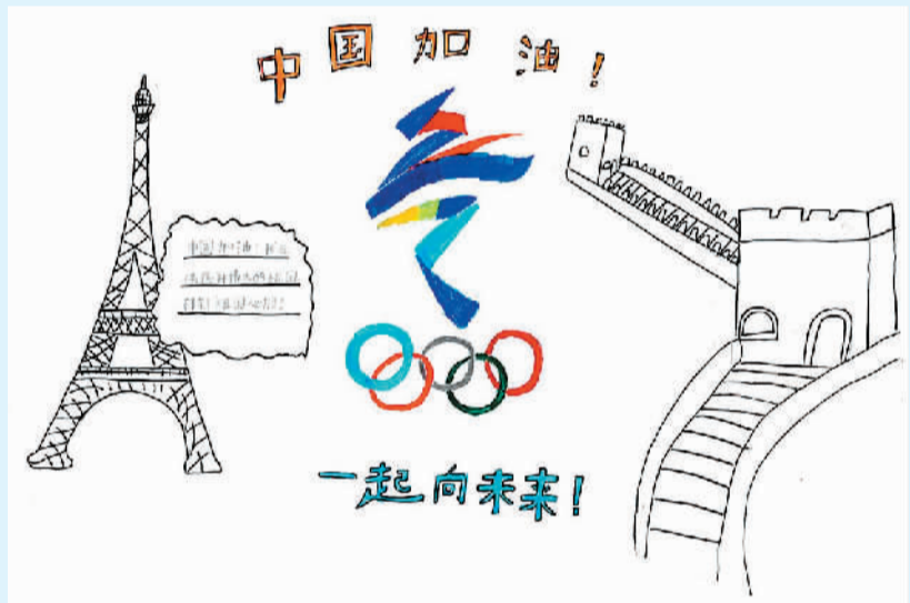
陈胡秋玥作 (寄自法国)