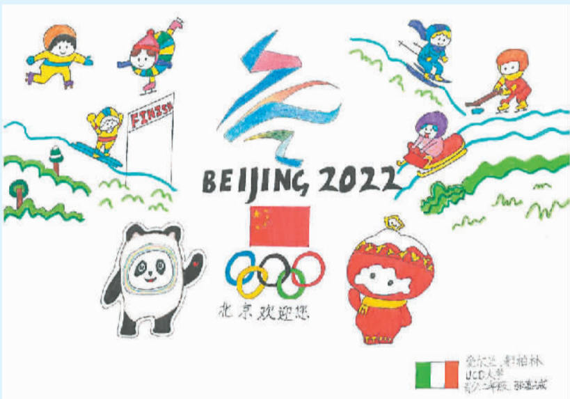
张嘉诚作 (寄自爱尔兰)

据悉，“汉学青年学者研习营”由国际儒学联合会发起策划，旨在联络、支持在中国历史文化、当代中国和中外人文交流等方面学有所长的青年学者，希望他们在世界汉学研究和国际文明交流领域发挥更大作用，为共绘美美与共的人类文明画卷贡献更大力量。