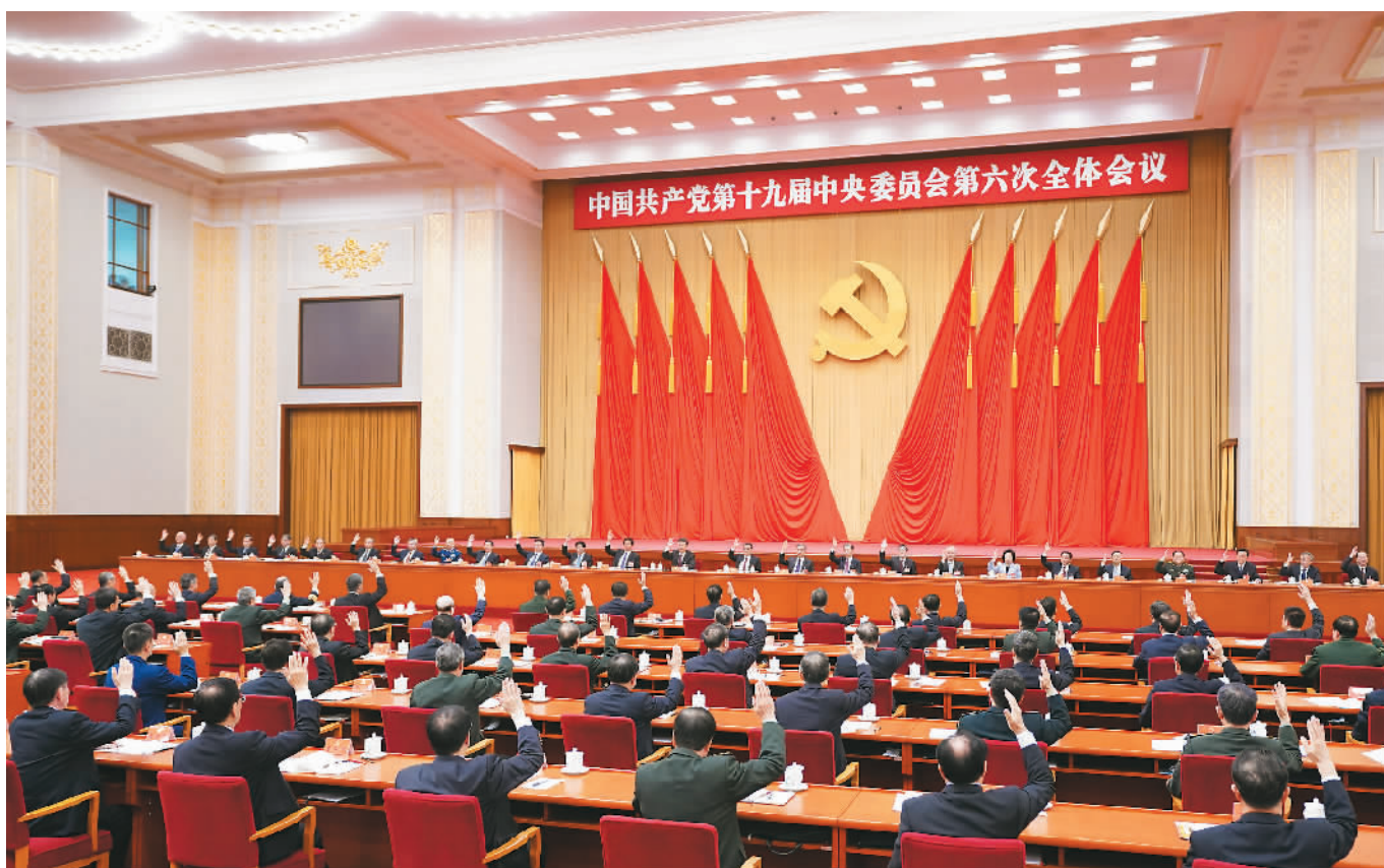
中国共产党第十九届中央委员会第六次全体会议，于2021年11月8日至11日在北京举行。中央政治局主持会议。