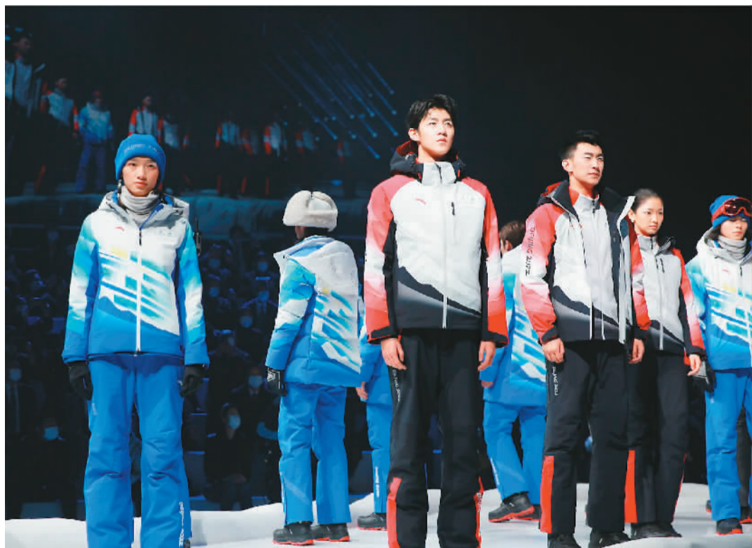
▲ 模特展示2022年北京冬奥会与冬残奥会系列制服装备。