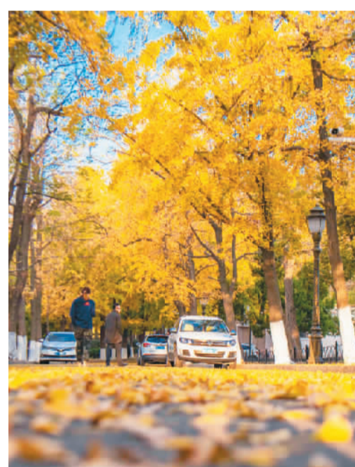
八大关秋景。