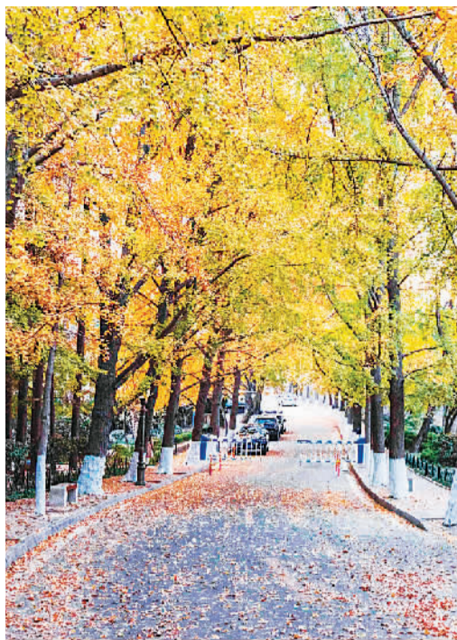
八大关函谷关路银杏大道。