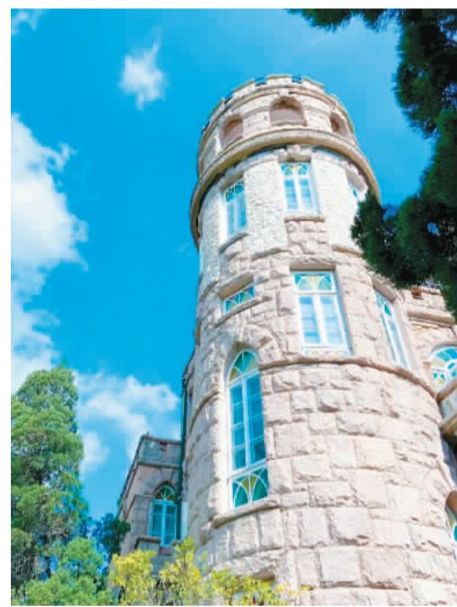
八大关花石楼。