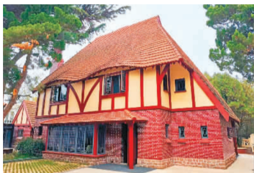
英国领事官邸旧址。