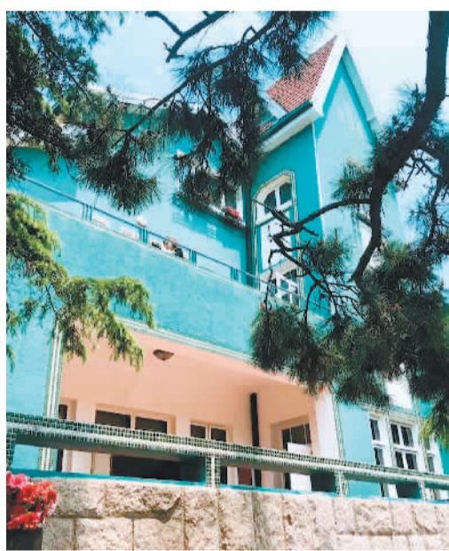
八大关公主楼。