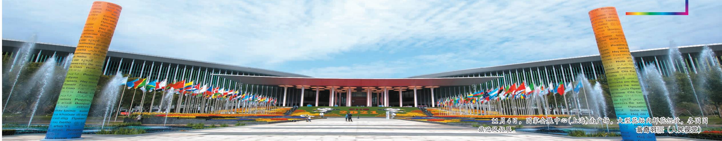
11月4日，国家会展中心（上海）南广场，大型花坛内鲜花怒放，各国国旗迎风招展。

从志愿服务到疫情防控，从交通保障到餐饮服务，从展商参展到安全保障……今年进博会上，服务保障亮点多多。