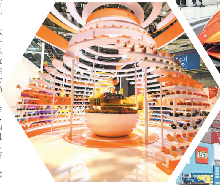
▲在第四届进博会食品与农产品展馆，各类水果琳琅满目。