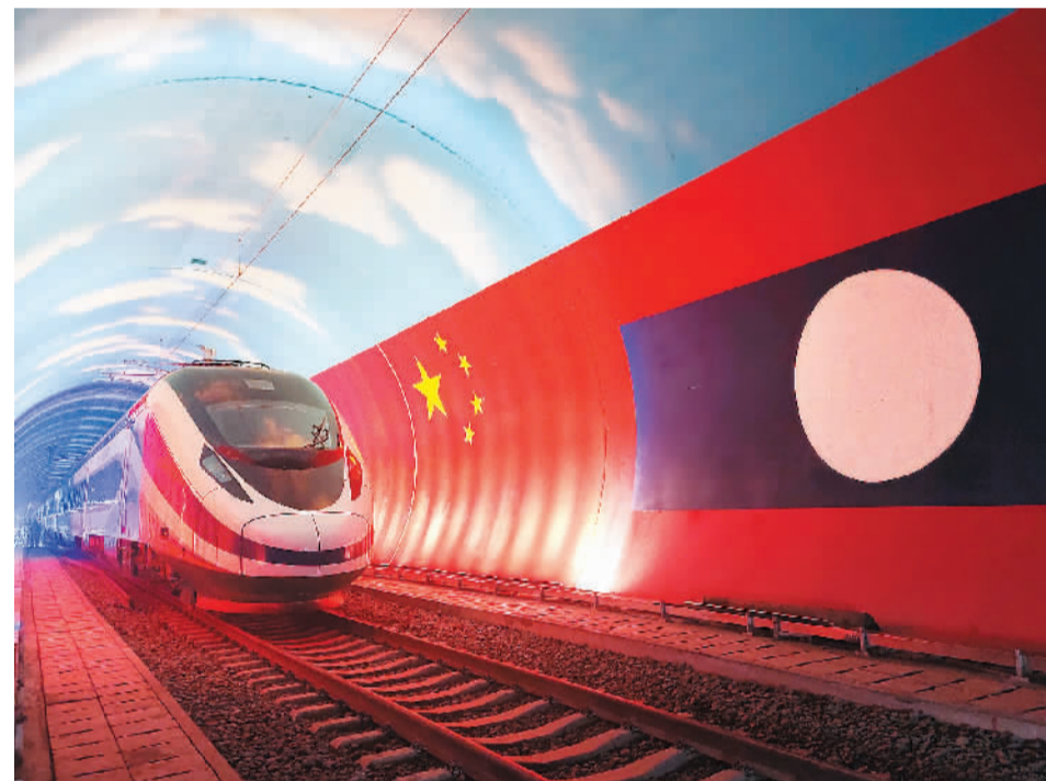
▲“澜沧号”动车组10月16日运抵刚刚建成的中老铁路万象站，正式交付老中铁路有限公司。图为10月15日，“澜沧号”动车组通过中老友谊隧道内的两国边界。

这条千余公里的钢铁巨龙，从昆明出发，穿越磨盘山、哀牢山、无量山，跨过元江、阿墨江、把边江、澜沧江，经过中老铁路友谊隧道进入老挝，最终抵达万象。通车运营后，这条友谊、科技、绿色、开放的铁路必将承载着中老两国人民的梦想，穿山越岭，创造辉煌。