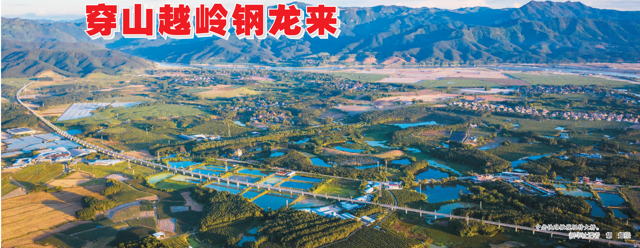
中老铁路琅琅坝特大桥。