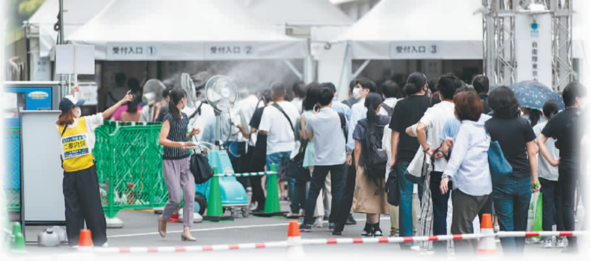
8月26日，日本东京一处新冠疫苗接种点，人们排起长队。