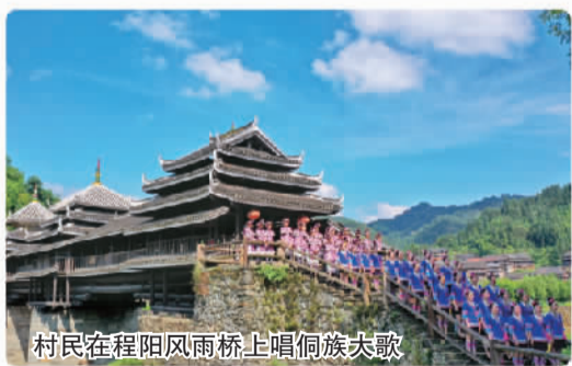
村民在程阳风雨桥上唱侗族大歌

蓝天白云下，三江侗族自治县程阳八寨景区内侗寨、风雨桥、鼓楼与青山相辉映，独特的民族风情、秀丽的自然风光吸引大批游客前来观光。