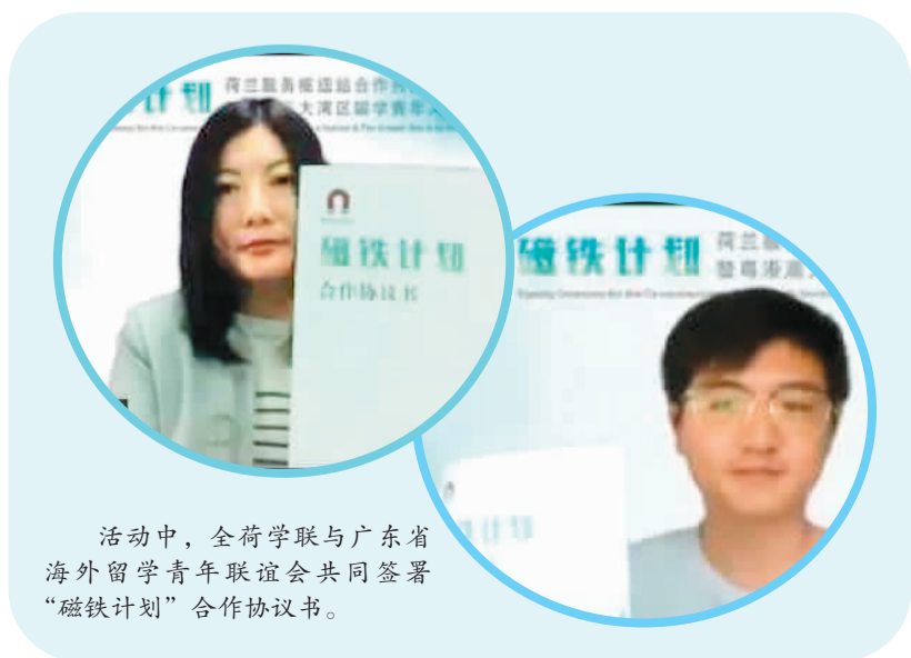
活动中，全荷学联与广东省海外留学青年联谊会共同签署“磁铁计划”合作协议书。

据了解，“磁铁计划”荷兰服务枢纽站今后将定期向在荷中国留学生发布粤港澳大湾区创新创业、人才服务等政策举措，对接相关项目落地实施，并为在荷留学人员回国工作提供建议，助力粤港澳大湾区招才引智。