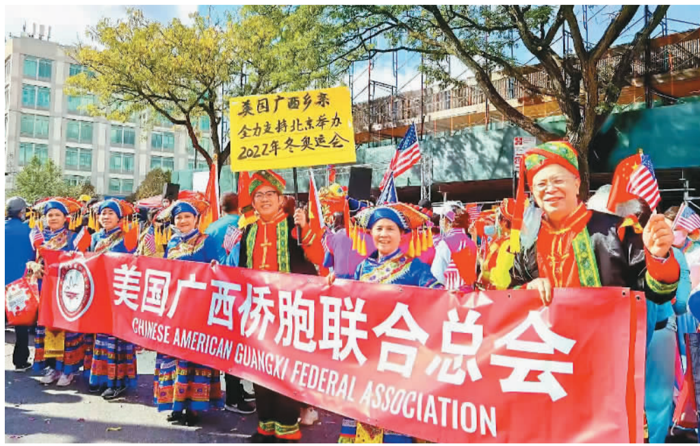
近日，美国纽约，美国广西侨胞联合总会的桂籍侨胞身着民族服饰，参加支持北京2022年冬奥会的活动。