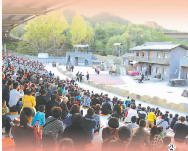
图②：观众观看情景剧《反扫荡》。