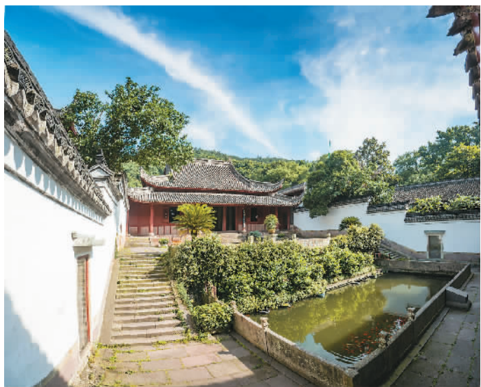
下图：保国寺古建筑群之北宋大殿外全景。

保国寺大殿不仅是11世纪中国木构营造技艺的代表性作品，更是中国建筑技艺通过“海上丝绸之路”传向海外的重要例证。“作为‘海上丝绸之路’重要始发港的宁波，在宋元时期与日本等国家间的商贸、人员以及