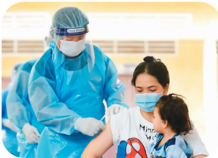
十月十四日，一名女子在柬埔寨金边接种科兴新冠疫苗。

法国《费加罗报》网站报道，根据英国艾尔菲尼蒂数据分析公司的数据，到2021年年底，全球新冠疫苗产量将超过120亿剂，其中一半将来自中国制造商。这是欧盟计划在2021年生产的30亿剂新冠疫苗数量的两倍。中国已向全球100多个国家提供了疫苗。“这表明中国人提高产量的速度有多快。”艾尔菲尼蒂蒂数据分析公司首席分析师卡罗琳·凯西解释说，“他们已经成为真正的行业冠军。迄今为止，没有任何别的国家生产出这么多新冠疫苗。”过去几个月，科兴生物与国药集团还通过在全球各地建立合作伙伴网络来强化生产。中国在新冠疫苗方面的突破，说明了中国制药行业的崛起。在生产仿制药和活性成分领域确立了地位之后，中国企业打算展示自己在创新方面的实力。