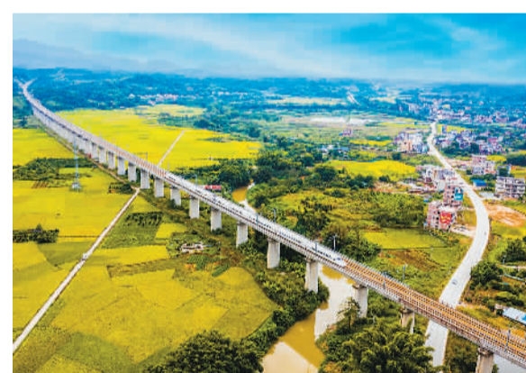
10月23日，广西梧州市龙圩区大坡镇河步村，万亩金黄的稻田与过境的广昆高铁，构成一幅美丽乡村画卷。